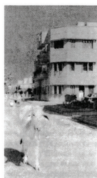
Figure 119: India: A cow as the confirmation of the city identity