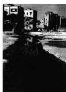
Figure 118: Calcutta: Open sewerage as the environmental problem