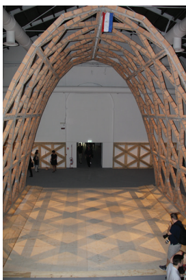
Национални павиљон Јапана En: Art of Nexus , аутори: Yoshiyuki Yamana, Посебна похвала (средина)