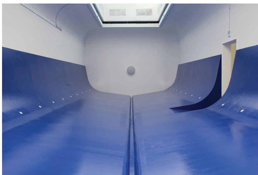
Српски павиљон: Heroik: Free Shipping Комесар: Иван Рашковић Ауторски тим: Стефан Васић, Ана Шулкић и Игор Сјеверца Уметнички савет: Љиљана Милетић Абрамовић, Игор Марић, Мирослава Петровић-Балубић, Радивоје Динуловић, Милан Ђурић, Владимир Миленковић, Борислав Петровић

Дијана Милашиновић Марић