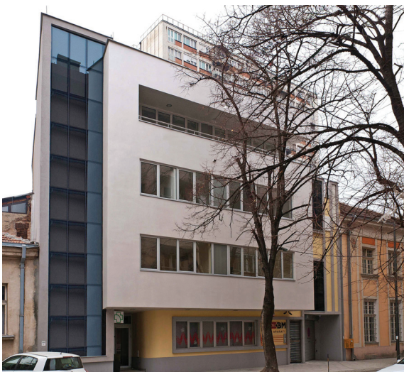
Реализација AUDIO BM, Архитектонски атеље AM, Кековић А., Петровић М., Кондић С., Србија, 2011.