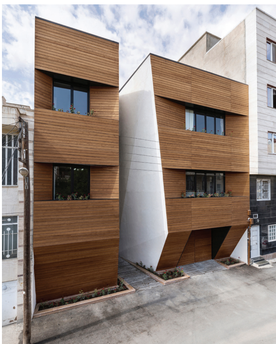
Реализација Кућа Afsharian , eNa Design Керманша, Иран, 2014.