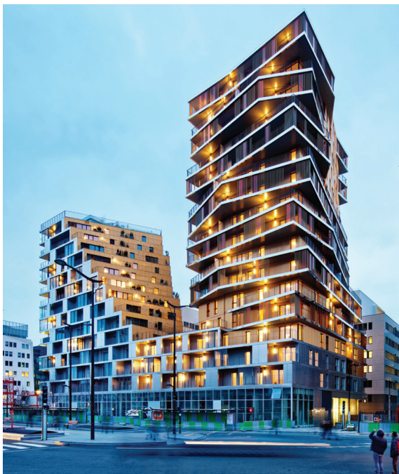
Реализација Зграда Bâtiment , Hamonc + Masson & Associés, Париз, Француска, 2015.