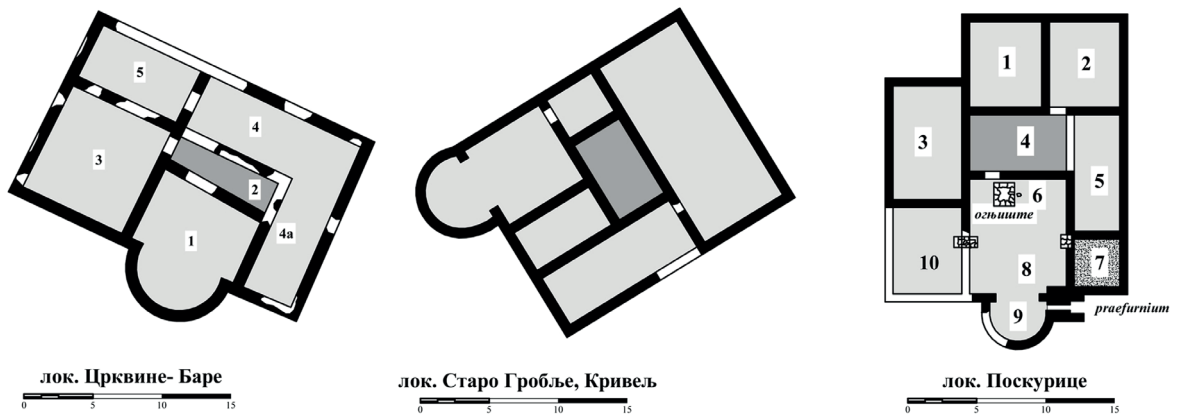
Сл. 2 Део грађевина са централним ходником које су анализирани у дисертацији

на територији Србије, систематизованих на основу хронолошког опредељења, економских, друштвених и политичких прилика настајања, положаја у односу на урбано ткиво, намену, геометријске и садржајне карактеристике. У наредним поглављима утврђен је утицај на формирање касноантичког стамбеног програма на територији Србије и приказана је упоредна анализа са укупном стамбеном архитектуром античког Рима. Кроз детаљну анализу архитектонских података и појединих откривених артефаката ауторка је реконструисала могући свакодневни живот становника који су обитавали у касноантичким стамбеним објектима различитог стамбеног комфора.