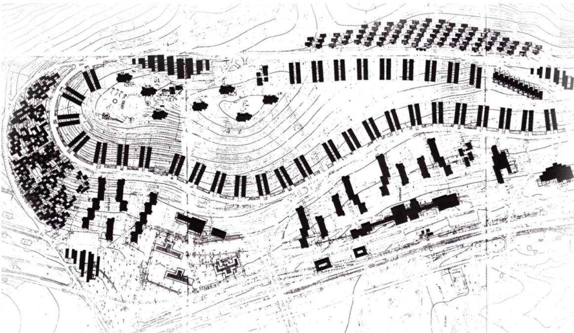
Детаљни урбанистички план IV месне заједнице у Бору, 1972. (Борко Новаковић, Ненад Спасић, Недељко Боровница)