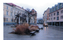
Slika . 84. Bratislava, urbani mobilijar i specifična vegetacija formiraju ambijent за komunikaciju i социјализaciju на uličnom prostoru. Primetiti parter bez derelivacija за pešake, tramvaje i automobile.