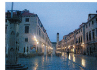
Slika . 162. Dubrovnik, Stradun, celina vredna po fantastičnoj integraciji arhetipskih urbanih elemenata.