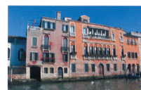
Slika . 161. Venecija, sinteza arhitekture pozicijom, razmerom, bojom, elementima i detalјima.