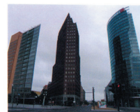
Slika . 4. Berlin, Potsdamer trg, tri vertikale kao repri početka / završetka uličnih pravaca.

127. Urbanitet у Prosvetinom leksikonu Vujaklija ima značenje: (urbanus l.) pristojnost, učtivost, uglađenost, str. 987; tema urbaniteta videti članak Ranka Radovića у knjizi “Živi prostor”, str. 58.