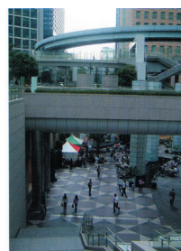
Slika . 83. Tokio, linearni potezi u različitim nivoima povezuju i razdvajaju; preklapaju i integrišu javne prostore grada за različito korišćenje.