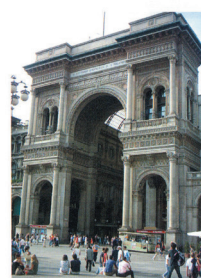
Slika . 5. Milano, ulazna kapija u natkrivenu pešačku ulicu Vittorio Emanuele на glavnom gradskom trgu.