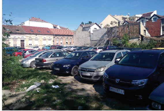
Сл. 11. и 12. Јавни паркинзи на слободним парцелама и проширењима у Алмашком крају