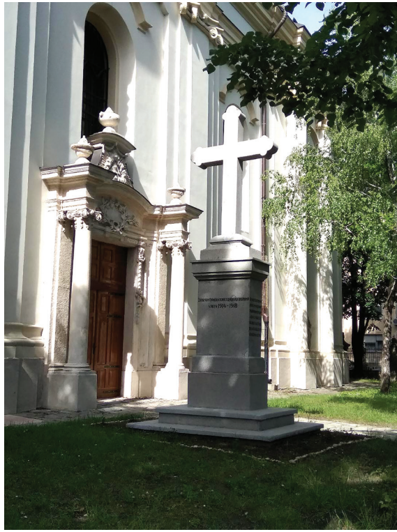
Сл. 1. и 2. Алмашка црква и крст