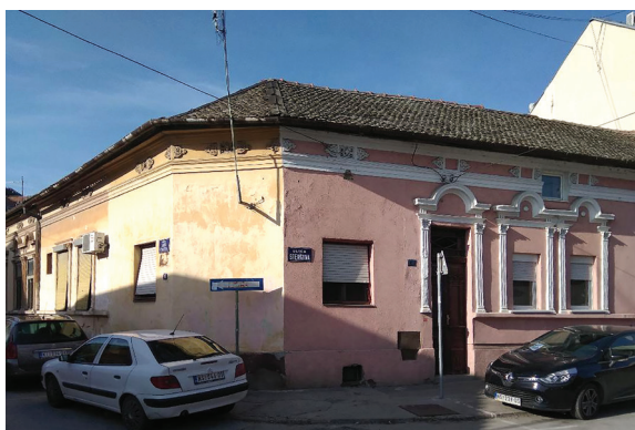
Fig. 21. and 22. Intersection with houses on the corners of Sava Vuković and Zemljane Ćuprije Street