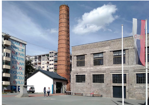
Сл. 3. и 4. Свилара прије и послије обнове