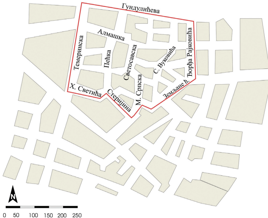
Карта бр. 1. Дио Алмашког краја обухваћен Планом детаљне регулације