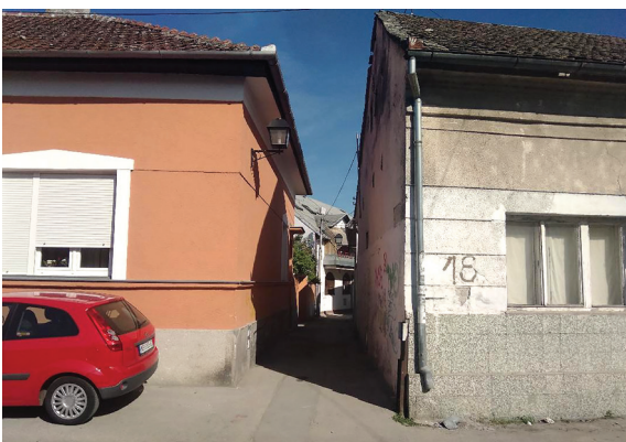
Fig. 5. and 6. Physiognomy of Almaški district