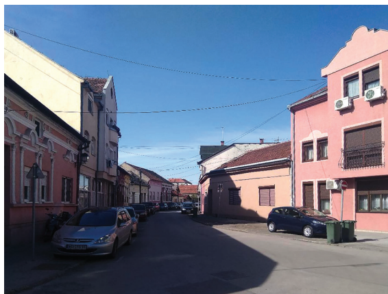
Сл. 19. и 20. Неадекватне зграде колективног становања (П+2+Пк) у Алмашком крају