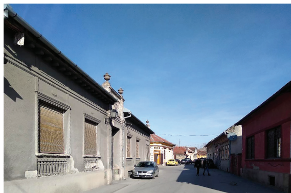
Сл. 5. и 6. Физиономија Алмашког краја