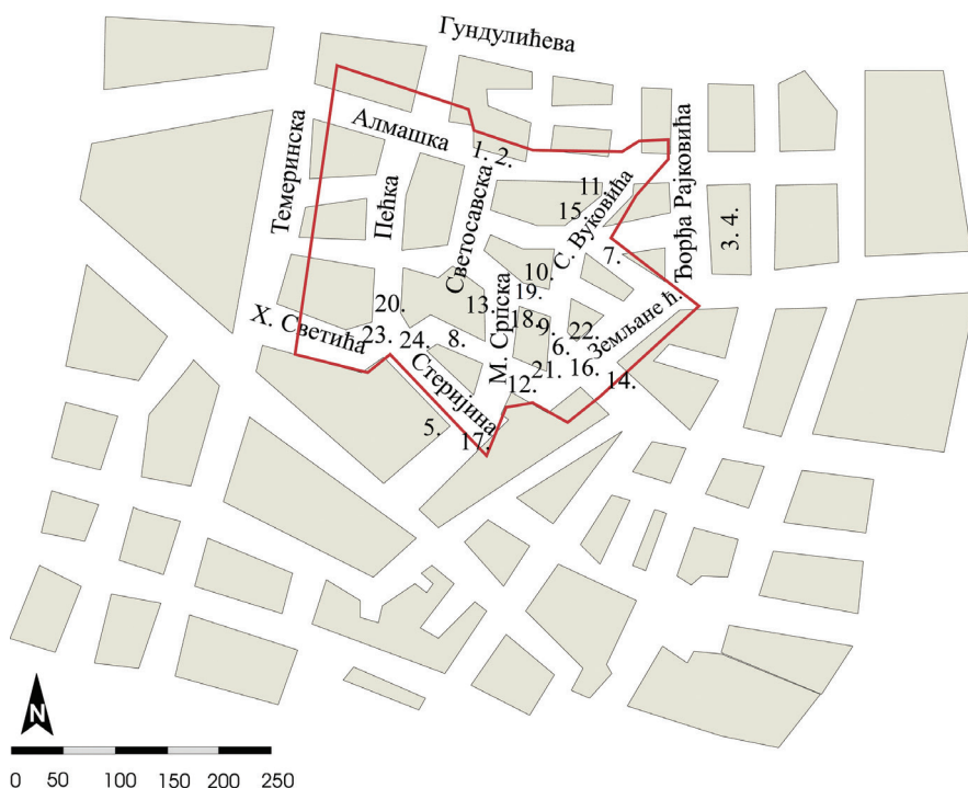
Карта бр. 2. Туристички атрактиван дио Алмашког краја са бројевима слика приказаних у раду