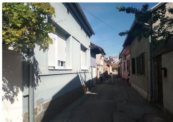
Сл. 7. и 8. Карактеристични уски и кривудасти сокаци Алмашког краја