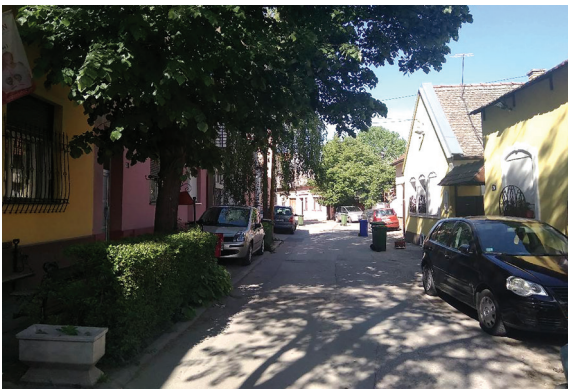
Fig. 13. and 14. Parked vehicles on the streets of Almaška district