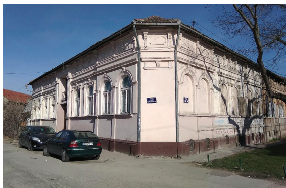
Сл. 21. и 22. Трговска проширења на укрштању улица Саве Вуковића и Земљане Њуприје