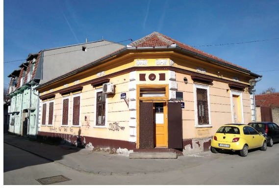
Сл. 9. и 10. Трговско проширење са кућама на угловима улица Саве Вуковића и Петра Кочића