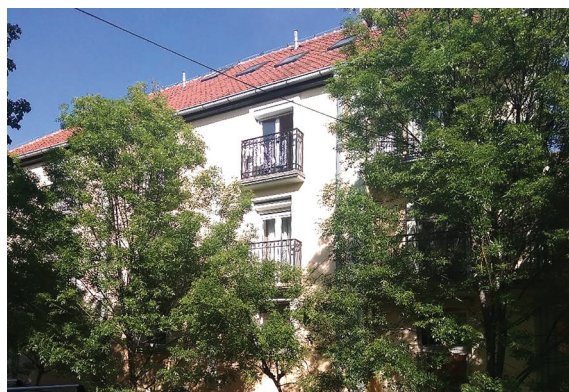
Сл. 17. и 18. Неадекватне зграде колективног становања (П+2+Пк) у Алмашком крају