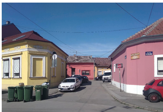
Сл. 23. и 24. Проширења на укрштању улица Стеријине, Барањске и Хаџић Светића