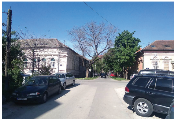
Сл. 15. и 16. Постојећи зелени фонд на улицама Алмашког краја