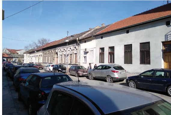
Сл. 13. и 14. Мирујући саобраћај у улицама Алмашког краја