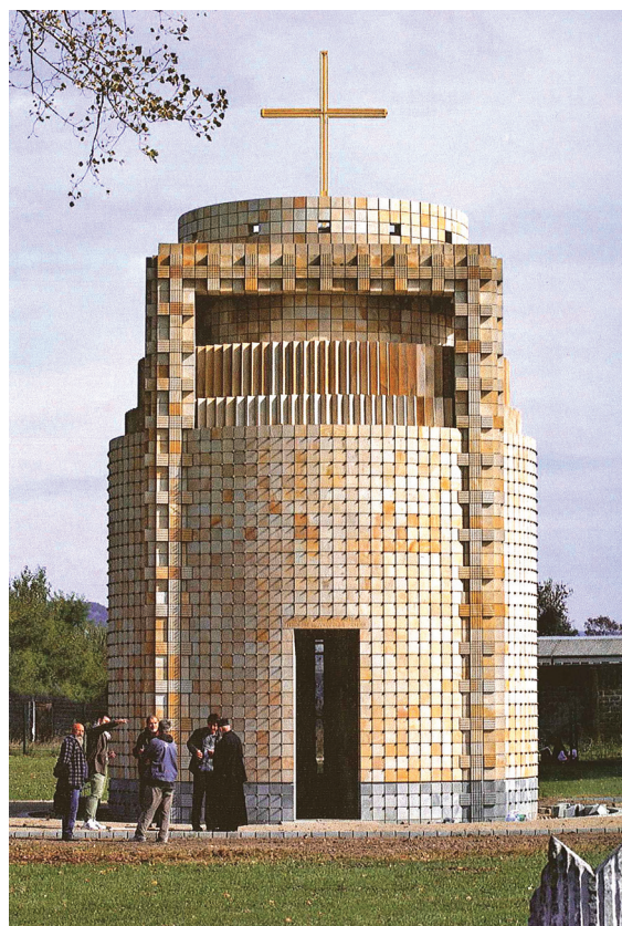
Капела родољуба, Гробље стрељаних 1941. Краљево, Србија, стр. 282-283.