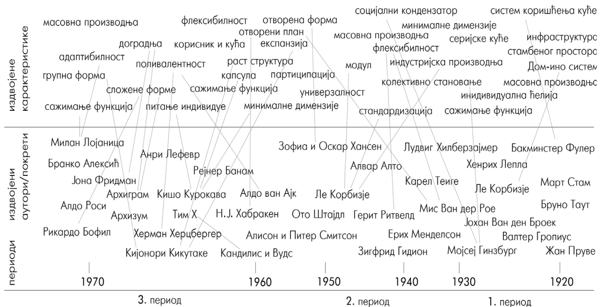
Сл. 1 Дијаграм са приказом развоја становања у току 20. века са фокусом на три периода, различите ауторе и значајне карактеристике; извор: аутор рада