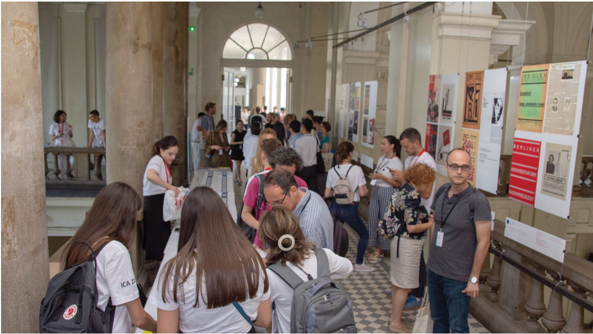
Изложба „100 година Баухауса: Контекстуализације и ре-контекстуализације Баухауса у југословенском уметничком простору“ на Архитектонском факултету у Београду