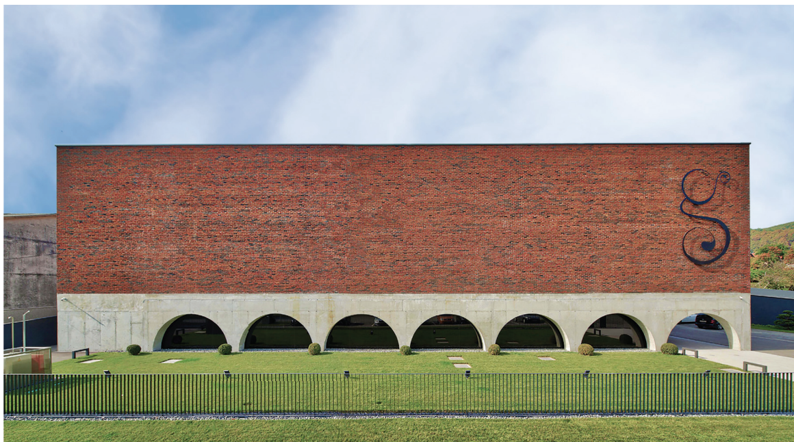
Награда у 2. категорији: Винарија Галиј , Кутјево, Хрватска, 2018., аутори: Томислав Ђурковић, дипл. инж. арх., и Зоран Зидарић, дипл. инж. арх.