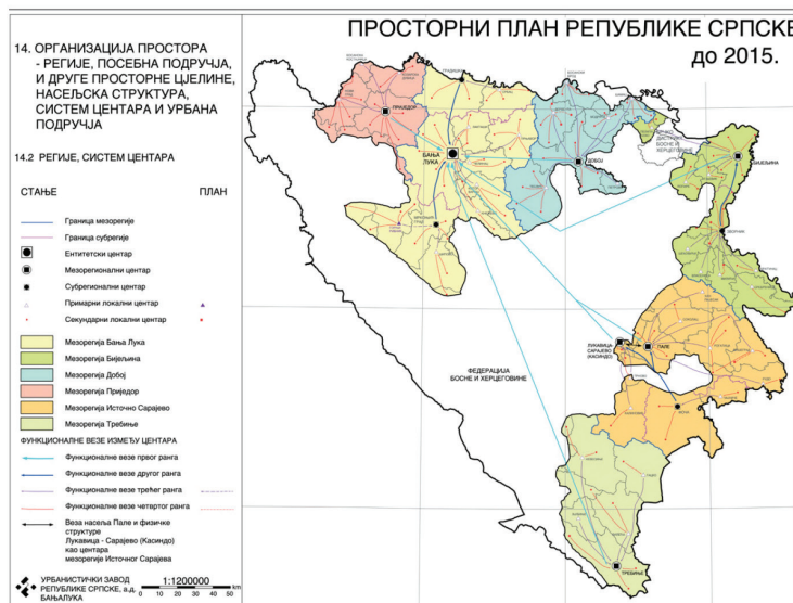
ДУП прве фазе привредне зоне Бара (2001) и ППРС 2008.