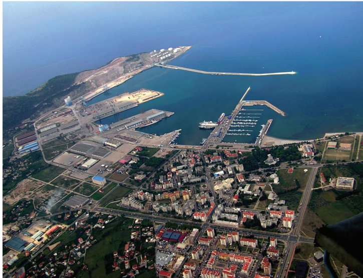
АЕРО-ФОТО СНИМАК ЛУКЕ БАРА И ДЕЛА ГРАДА БАРА