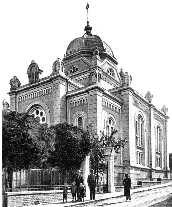
Слика горе лево, страна 165. Опатија, неизведена синагога, перспективни приказ, пројекат V. G. Angyal, 1925.