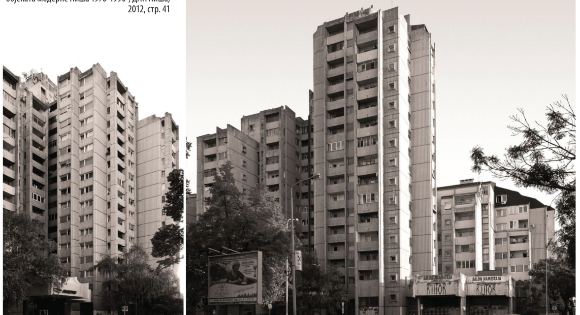
Слика 2. Садашњи изглед објекта на Тргу 14. Октобра Извор: Монографија и изложба „50 објекта модерне Ниша 1970-1990“, ДАН Ниша, 2012, стр. 41