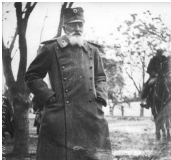
Сл. 3. Генерал Божидар Јанковић, Командант Треће српске армије 1912 (из документације аутора)