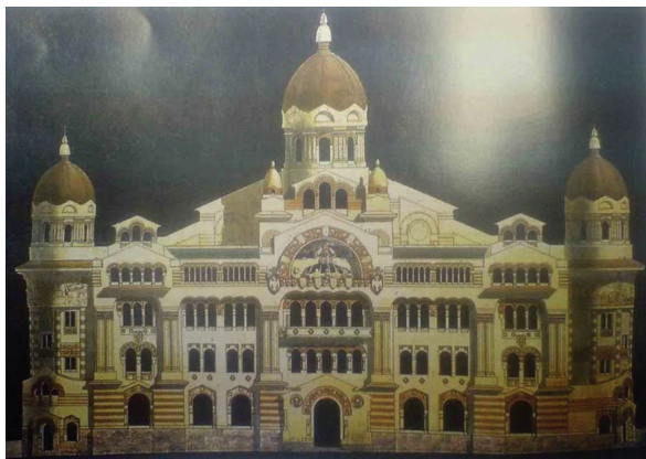
Сл. 6. Неизведена скица „Главне поште“ 1912–1914, Београд (из породичне заоставштине арх.М.Коруновића) Fig. 6. Unexecuted sketch of the Main Post Office (1912–1914), Belgrade (from the family's legacy of M.Korunovic)

симболом „окупације из 1912. год.“, албански екстремисти су је дуго толерисали због њене користи за локално становништво.