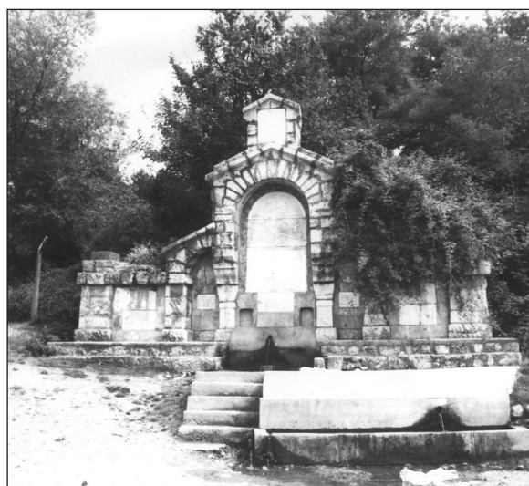
Сл. 5. „Студенац Косово”, Призрен, изглед из 1996. год. (из документације Покрајинског завода за заштиту споменика културе у Приштини)

Fig. 4. Fountain "Kosovo", Prizren, look at the end 1912. god. (from the family's legacy of M. Korunovic)