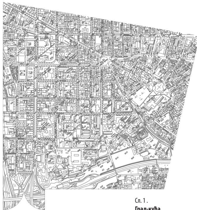
Сл. 1. Град-кућа

Начелно, дефиниција аутономности подразумева могућност самосталног организовања и управљања, а да би она постојала потребан је проблем или програм који се организује.