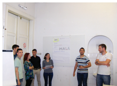
Сл. 7, ренинг Интегрални концепт урбаног дизајна

Интегралан урбани дизајн је коришћен као метод у којем је могуће креирати нове вредности, обједињујући различитости у креативном миљеу за комуникативну акцију. Овакав процес, поред креативности и имагинације, обједињује top-down и bottom-up приступ у интегралном креирању одрживих места (Сл. 7). Отвореност у приступу поставља ову изложбу у укупан циклус итерације имајући за циљ активну партиципацију ширих интересних страна путем давања предлога и реаговања на предложене визије, циљеве, стратегије.