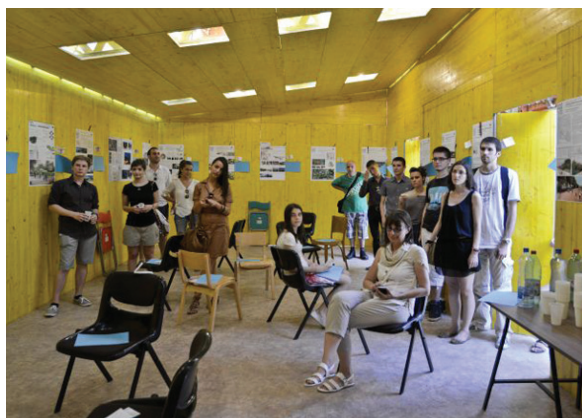
Сл. 8 Urban Incubator featuring... АРХИТЕКТОНСКИ ФАКУЛТЕТ: Изложба студенских радова Интегрални урбани дизајн у регенерацији Савамале