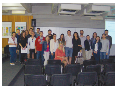
Сл. 1. и 2 Разговор са представницима ЈУП Урбанистичког завода Београда