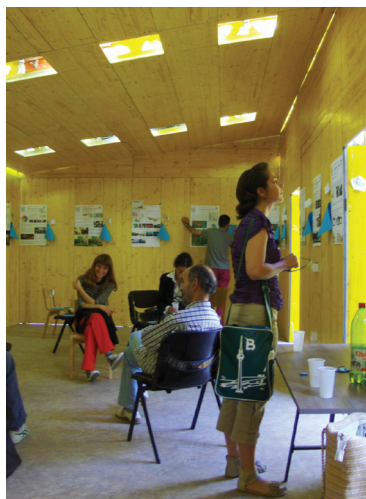
Сл. 9 Манифестација Изложба у дијалогу