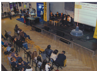
Слике 5. и 6: Учешће у Миксер фестивалу