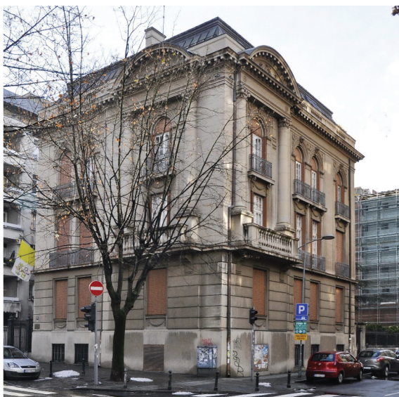
Сл. 5 Зграда данашње Папске нунцијатуре, изглед око 2017. године / Fig. 5 The building of today's Papal Nunciature, appearance around 2017

наручилаца (Kadijević, 2023, 156). Ауторство архитекте Ђорђевића се може утврдити на основу специфичног рукописа, цртачке вештине, осмишљавања детаља и обавештавања Грађевинског одбора о приспећу планова.