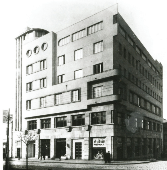
Сл. 9 Дом југословенских железничара и бродара, 1936. година / Fig. 9 House of Yugoslav Railwaymen and Shippers, 1936