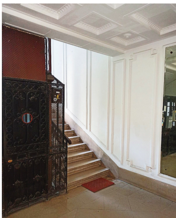
Сл. 6а Улазни хол у згради Николе Узуновића, данашњи изглед / Fig. 6a Entrance hall in the Nikola Uzunović building, present day appearance

посматрача изазове утисак изразите монументалности (Nestorović, 1973, 363–364). Дуж фасаде се хоризонтално нижу прозори надвишени забатом, а изнад њих лучни прозори окружени гирландама. Балустраде и коvine ограда балкона поседују декоративну функцију по узору на француске примере (Nestorović, 1973, 342). У зони ентаблатуре смештен је рељеф брода болнице Devanha и натпис Палата Devanha , указујући на чињеницу да је тај брод спасио живот Узуновићу током Великог рата (Putnik Prica, 2021a, 103). Снажни венац одваја елевацију од четвртог спрата на ком се простиру увучени балкони и троделни прозори. Визуелним решењем палате доминирају уситњени ритам повлачења архитрава, едикула на врху