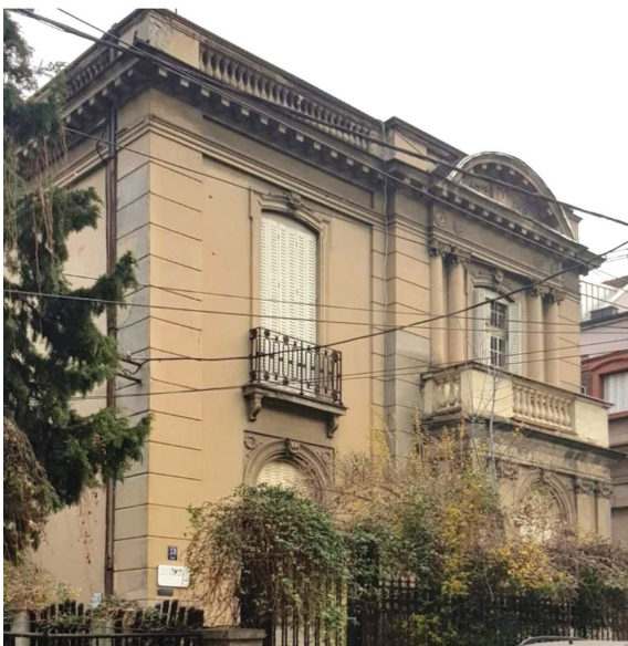
Сл. 4 Кућа Лазара Костића, изглед око 2020. године / Fig. 4 House of Lazar Kostić, appearance around 2020