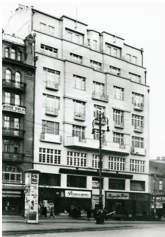
Сл. 8 Палата Осигуравајућег друштва Југославија, 1931. година / Fig. 8 Palace of Yugoslavia Insurance Company, 1931