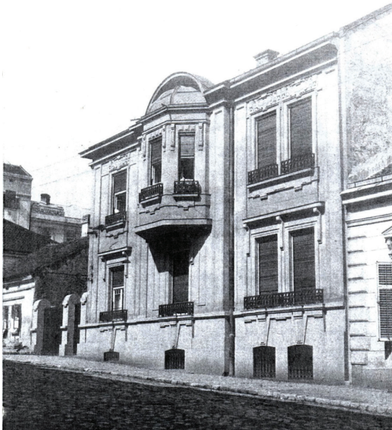
Сл. 3 Зграда Алексе Поп Митића, изглед око 1926. године / Fig. 3. Building of Aleksa Pop Mitić, appearance around 1926