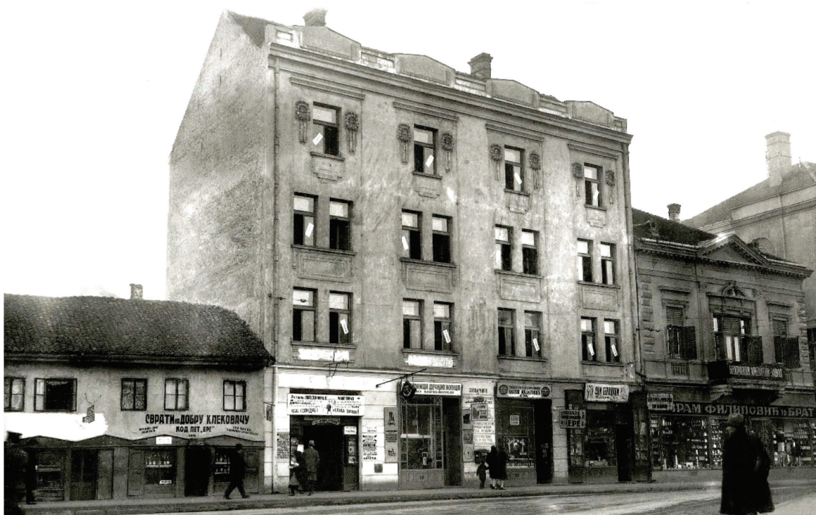
Сл. 2 Зграда Јулке Гарашанин, изглед око 1929 / Fig. 2 Building of Julka Garašanin, appearance around 1929.