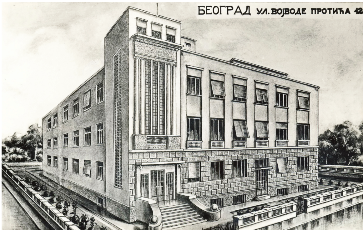
Сл. 10 Цртеж уличног pročеља данашње Хришћанске адвентистичке цркве, 1933. година / Fig. 10 Drawing of the street facade of today's Christian Adventist church, 1933

На имању католичке београдске надбискупије у Улици Радослава Грујића 4, од 3. јуна до 28. августа 1933. године, трајала је изградња Новог завода/Француске школе браће Мариста. 50 (Сл. 10) Двотрактни облик основе сутерена, приземља и два спрата артикулисан је подужним ходником одакле се приступало трпезарији, салону за пријем, спаваоницама, просторији надзорника, капели, библиотеци и купатилима. Просторно-визуелну доминанту представља леви корпус грађевине, у чијем подножју се налази главни улаз акценован подестима, апстрахованим стубовима и надстрешницом. На масивном волумену спратног дела се уздижу удвојени јонски полустубови који носе ентаблатуру и поткровни венац. Између њих се простире застакљена степенишна вертикала, решена у виду мреже квадрата. Над снажно истакнутим поткровним венцем се наставља равни кров са три прозора и носачем за заставу. Бочни тракт објекта се складно надовезује хоризонталним низом прозора и балустрадама првог спрата, груписаним лезенама и фасадним испустом. Задржавајући академски корпус редуковане фасадне декорације, Ђорђевић је постигао синтезу модернизованог академизма (Maneвић, 1979; Maneвић, 1988).