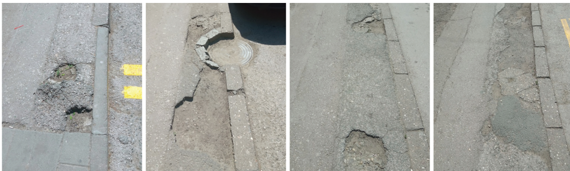
Сл. 5. Стање коловоза на Трифковићевом тргу / Fig. 5 Condition of the street road at Trifković Square