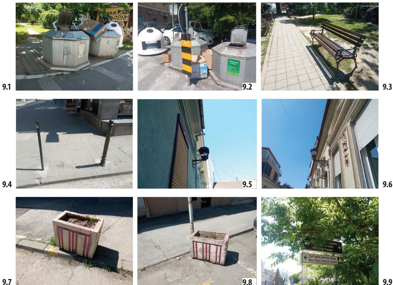
Сл. 9.1-9.9. Урбана опрема на Трифковићевом тргу / Fig. 9.1-9.9 Urban equipment on Trifkovic Square

Основне карактеристике објеката који окружују Трг су њихова различитост и међусобна неусаглашеност, како по старости, висини, облику, волумену, тако и по стилу