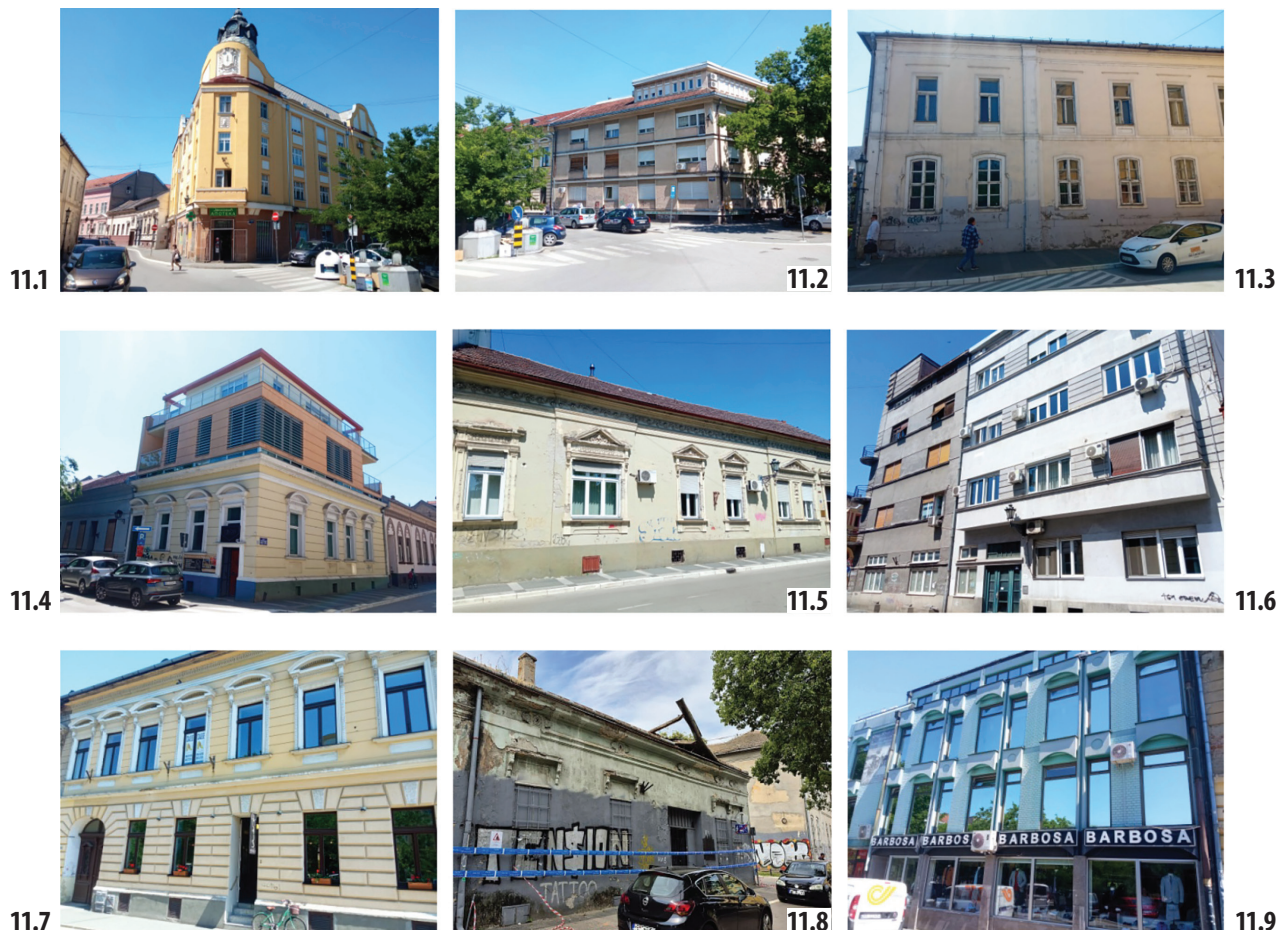
Сл. 11.1-11.9. Урбане структуре на Трифковићевом тргу / Fig. 11.1-11.9 Urban structures on Trifkovic Square