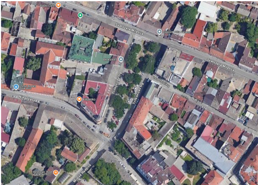
Сл. 1. Положај и изглед Трифковићевог трга данас Fig. 1 The location and appearance of Trifković Square today

враћена првобитној намјени. Године 1892. одлуком истог органа објекат је порушен (Сл. 3.1).