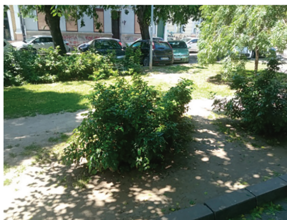
Сл. 8.1-8.3. Стање зеленила и зелених површина на Трифковићевом тргу / Fig. 8.1-8.3 The condition of greenery and green areas on Trifković Square

На Тргу се налази тридесетак вишегодишњих стабала копривића (Сл. 1, 4.2 и 8.2) и жалосног јасена посађених око паркинга, изнад кога се у висину дижу њихове густе крошње. У централном дијелу посађено је украсно шибље и грмље распоређено без икаквог реда, као и сто садница ружа у једном кругу, које су временом проријеђене и изгубиле естетску форму. Травната површина између ивичњака само дјелимично постоји, јер је, усљед сталног гажења, у значајној мјери девастирана (Сл. 8.1). Генерално гледано, цјелокупно стање зеленила на тргу није на завидном нивоу. Крошње копривића и жалосног јасена су веома густе и остављају утисак нереди (Сл. 8.2), тако да поједине крошње и густо грање сасвим прекривају