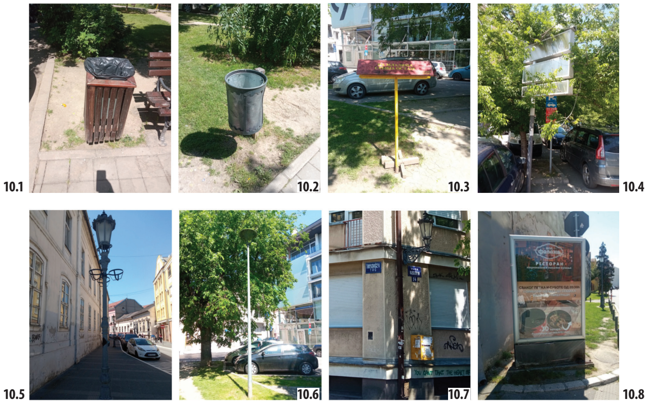
Сл. 10.1-10.8. Урбана опрема на Трифковићевом тргу / Fig. 10.1-10.8 Urban equipment on Trifkovic Square

и садржају. Са становишта старости издвајају се објекти грађени средином 19. вијека (Сл. 11.3, 11.5, 11.7 и 11.8), они грађени почетком или у првој трећини 20. вијека (Сл. 11.1 и 11.6), они из друге половине 20. вијека (Сл. 11.2 и 11.9), те они најновијег датума, као што је зграда „Levi nine“ (Сл. 7.2). Спратност објеката се креће од П до П+3, а архитектонски стилови који су заступљени на Тргу су историцизам, неоренесанса, еклектика, сецесија, примијењени социалреализам, те модерна (Објекти у старом градском језгру – Анализа Завода за заштиту споменика, 1994).