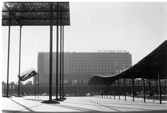
Сл. 3. А. Виापлана, Х. Пињон, трг Сантс, Барселона, 1983. Fig. 3. A. Viaplana, H. Piñon, Sants square, Barcelona, 1983.

Моралесу, морфологија каталонске архитектуре заснована је на еклектичном концепту између: 1) наговештаја лојалности према локалној модерној традицији педесетих и шездесетих коју су обележили Кодерх (Josep Antoni Coderch), Состреш (Josep M. Sostres) и Боигас; 2) асимилације у типоморфолошке анализе италијанског неорационалисте Росија (Aldo Rossi), која је овде ипак специфична (Сл. 2), јер показује оскудан ентузијазам за класичну и метафизичку строгост Росијеве поетике (de Solà-Morales, 1986:16).