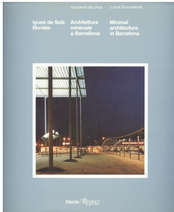
Сл.1. Architettura minimale a Barcellona: construire sulla città costruita , 1986, насловна страна Fig. 1. Architettura minimale a Barcellona: construire sulla città costruita , 1986, cover page