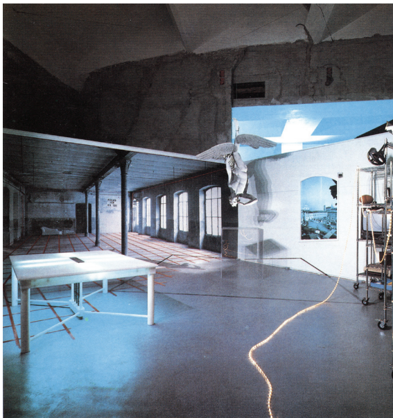
Сл. 9. П. Дероси, инсталација за XVII тријенале у Милану, 1983. Fig. 9. P. Derossi, installation for the 17 th Milan Triennale, 1983.

Претходно спроведена компаративна анализа селекције слабих архитеката води ка следећој поенти: (1) у Architettura minimale и Arquitectura débil Де Сола-Моралес користи исту теорију, тј. исте интерпретативне моделе слабе мисли (посебно Verwindung и decorum ) преко којих успоставља идентичан однос са осталим постмодерним архитектонским тенденцијама, али (2) разлика у примерима архитектонске праксе која стоји испред (или иза) ове теорије