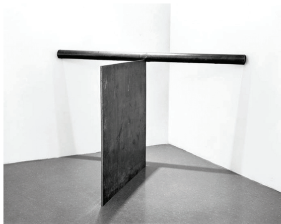
Сл. 4. Р. Сера, Equal, 1970. Fig. 4. R. Serra, Equal, 1970.