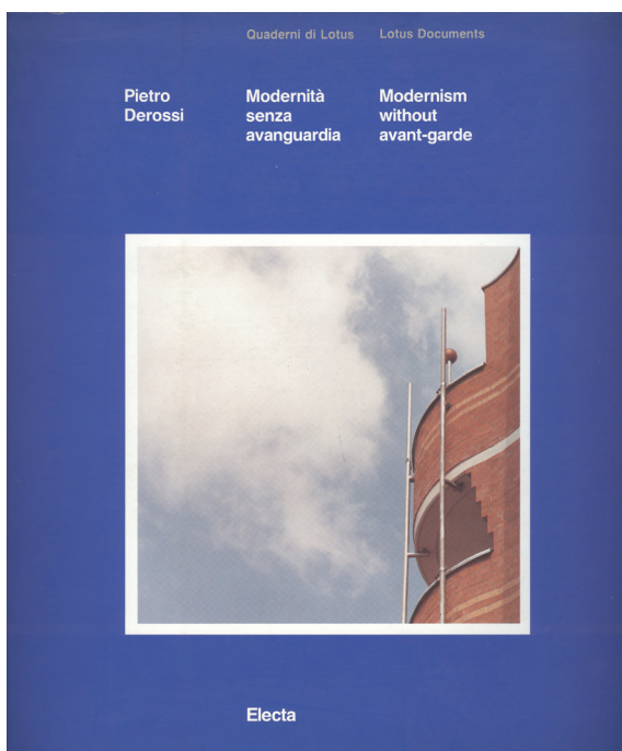
Сл. 10. Modernità senza avanguardia , 1990, насловна страна Сл. 10. Modernità senza avanguardia , 1990, cover page

је посебно интересантна, јер (3) у Architettura minimale представљен је ограничен домен каталонске архитектуре, док од Arquitectura débil на даље слабост постаје опис интернационалне архитектонске панораме.