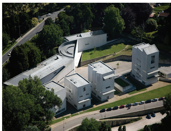
Сл. 8. А. Сиза, Школа архитектуре, Оporto, 1992. Fig. 8. A. Siza, School of Architecture, Oporto, 1992.