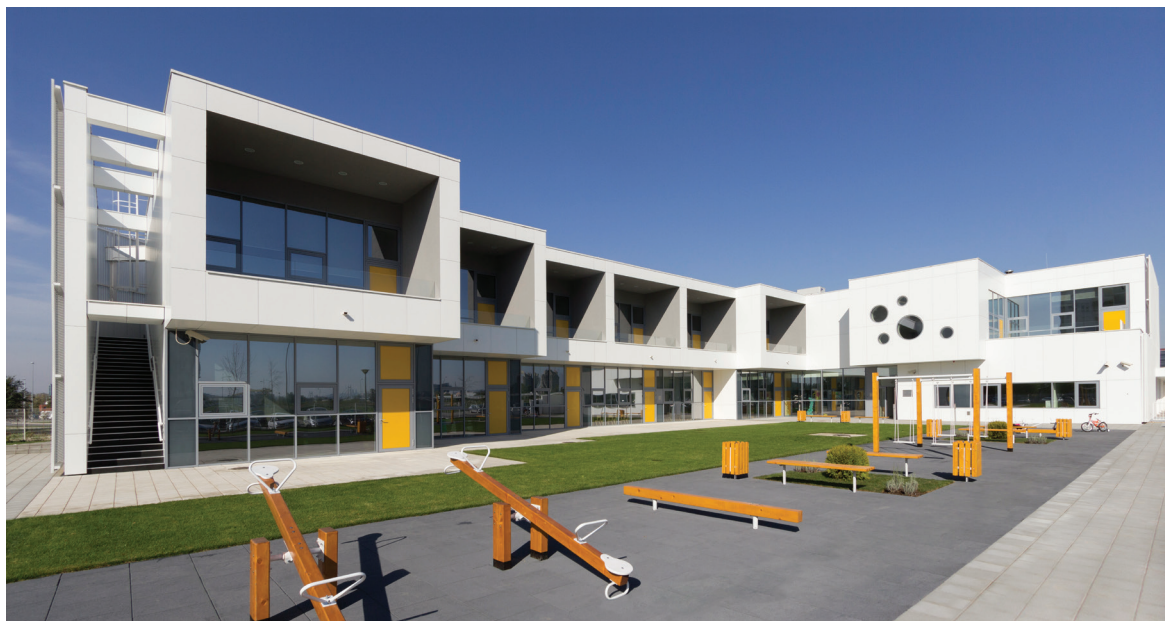
Поглед из дворишта

Одричући се могућности стварања романтичарских, презасићених архитектуралних прича, систем је заиста преузео превласт над бићем и изградио идентитет. Остала је само могућност неутралне, искрене, чисте, лако читљиве структуре која истински служи остваривању потенцијала грађења идеалног света детињства - онога који гради дете.