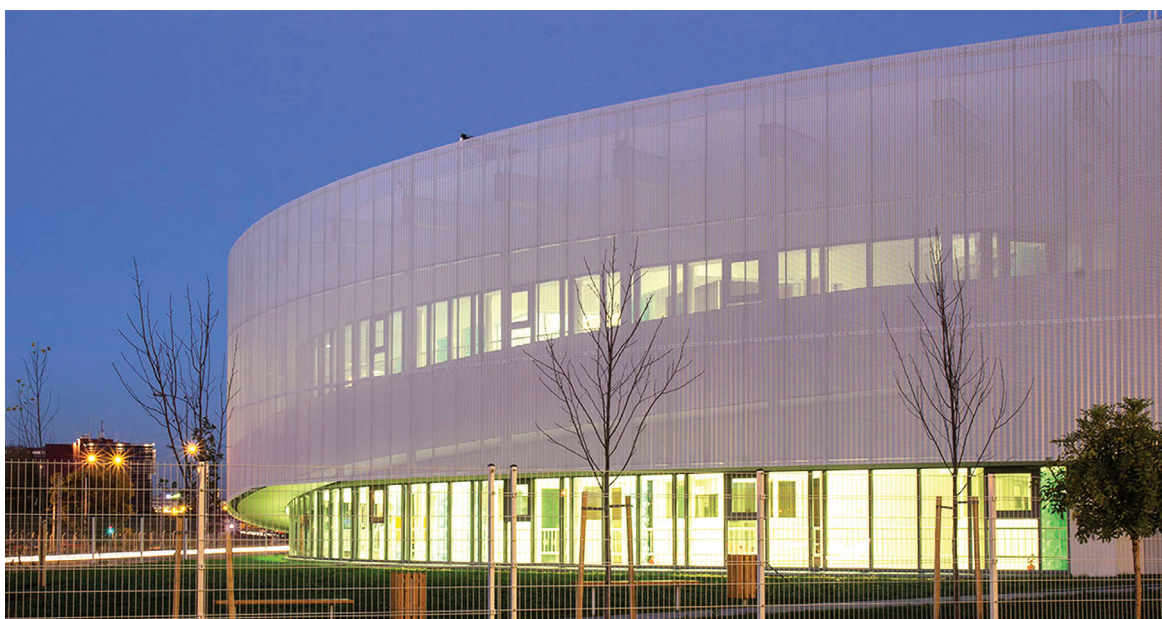
Поглед из дворишта