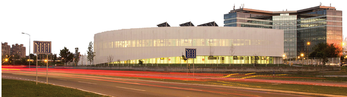
Поглед из улице Ђорђа Станојевића

Разни социолози означили су ово разграничавање као