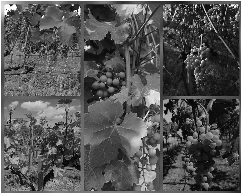
Slika 1 i 2. Vinograd Plavinci i sorta Panonia u različitim fenofazama razvoja Figure 1 and 2. Plavinci vineyard and Panonia variety in different phenophases