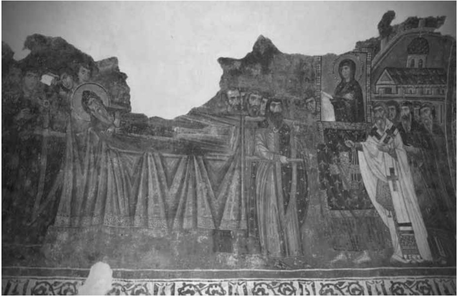
Сл. 5 Пренос моштију Свeйџоi Симeонa , параклис Светог Симeонa, Сопoћани ( https://www.blagofund.org/Archives/Sopocani//Pictures/Chapel_of_St_Symeon_Nemania/TrTranslati_of_relics_of_St_Symeon_from_the_north_wall/Translation_of_relics_of_St_SymeSy_Nemania_from_Hilandar_Mt_Athos_to_Studenica_Serbia/CX4J0473.html , Приступљено 5. 9. 2020)

У јужном параклису уз унутрашњу припрату цркве Свете Тројице у манастиру Сопоћани, фреске су делимично очуване (Ђурић 1963: 80, 82). На северном зиду параклиса налази се сцена Пренос Симеонових моштију из Хиландара у Студеницу (Сл. 5) која ликовно подсећа на истоимену сцену у Студеници. На њој се могу уочити портрети Вукана и Стефана, како носе одар са моштима и вероватно Саве, који је десном руком ухватио Вукана за мишицу (Ђурић 1964: 77). Тиме су представљена сва три брата како преносе очево тело у Студеницу.