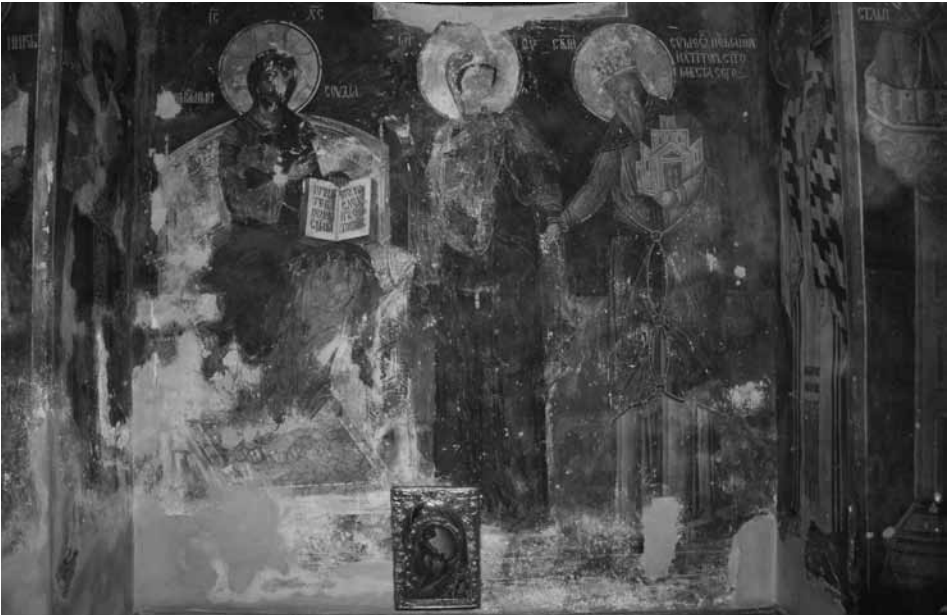
Сл. 2 Ктиторска композиција, Богородичина црква, Студеница ( https://www.blagofund.org/Archives/Studenica/Main/Pictures/Interior/Naos/Western_bay/South_wall/South_wall_-_first_row/STUD_2_IMG_7022.html , Пристуљено 5. 9. 2020)

Уместо Светог Саве је, како се претпоставља, првобитно био приказан Стефан Првовенчани јер је Стефан Немања њему пренео ктиторска права над Студеницом, док је на месту лика Стефана Дечанског могао бити