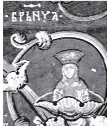
2) Стојећа фигура принцезе Брнче (Немањина лоза у Грачаници, око 1318. године); Стојећа фигура принцезе Брнче (Немањина лоза у Пећи, око 1334-1337. године; Торзо принцезе Брнче (Немањина лоза у Дечанима, око 1346-1350. године)