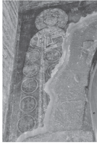
Сл. 6 Радослав, источни зид куле, Жича