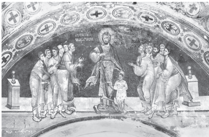
Сл. 9 Фреска Ако не будете као ово дете и орнаментална трака, западни зид куле, Жича (Чанак Медић и др. 2014: 333)