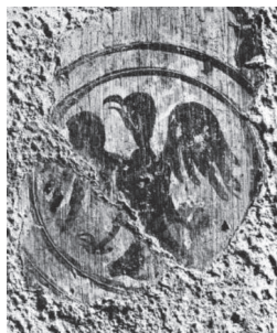
Сл. 2 Медаљон са мотивом једноглавог орла из Радослављеве припрате (Ђурић 1988: 130)