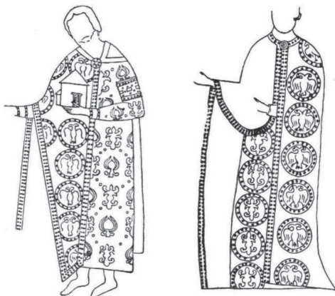
Сл. 4 Краљ Радослав и краљица Ана, цртеж (Ковачевић 1953: 31)