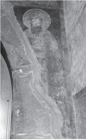
Сл. 5 Краљ Стефан Првовенчани, источни зид куле, Жича