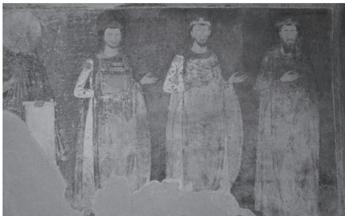
Сл. 10 Ктиторско-породична композиција, Милешева ( https://www.blagofund.org/Archives/Mileseva//sr/Pictures/Interior/Portraits_of_Nemanjic_Dynasty/MIL_2_IMG_2256.html , Приступљено 29. 1. 2022)