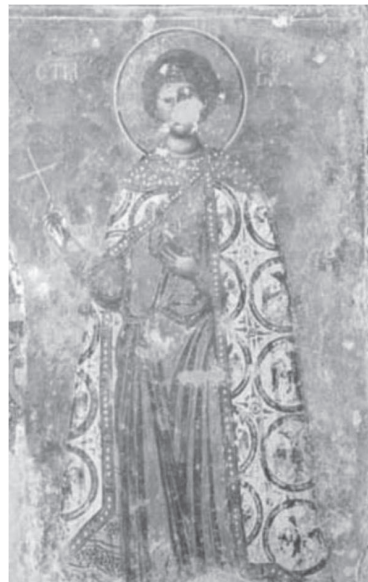
Сл. 8 Свети Ђорђе, јужни параклис, Жича (Чанак Медић и др. 2014: 311)