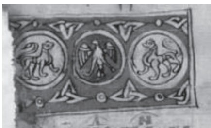
Сл. 13 Минијатура у Београдском паримејнику ( https://digitalna.nb.rs/wb/NBS/Zbirka_cirilskih_rukopisnih_knjiga_NBS/RS-652#page/0/mode/1up , Пристаљено 29. 1. 2022)