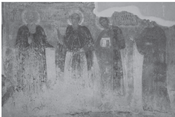
Сл. 3 Св. Симеон, Стефан Првовенчани, краљ Радослав и Ана; Радослављева припрата ( https://www.blagofund.org/Archives/Studenica/sr/Main/Pictures/Interior/Exonarthex_King_Radoslav_s_narthex/South_parecclesion_-_dedicated_to_Saint_Simeon_Nemanja/South_wall/South_wall_-_first_row/STUD_3_IMG_5338.html , Приступљено 28. 1. 2022)