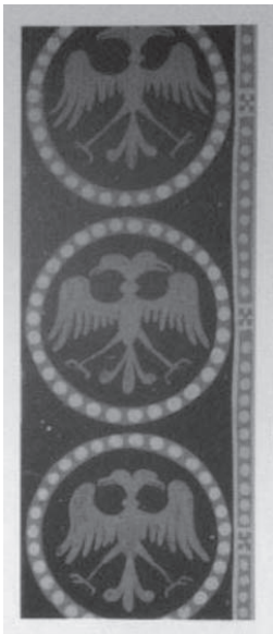
Сл. 7 Мотив двоглавог орла на одежди краља Стефана Првовенчаног и Радослава (Миловановић 2013: 191)