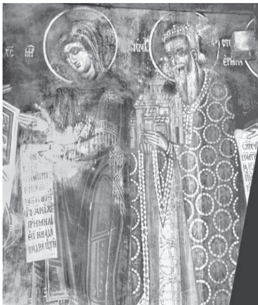
Сл. 12 Богородица и кнез Стефан Вукановић, Морача (Војводић 2006: 77)