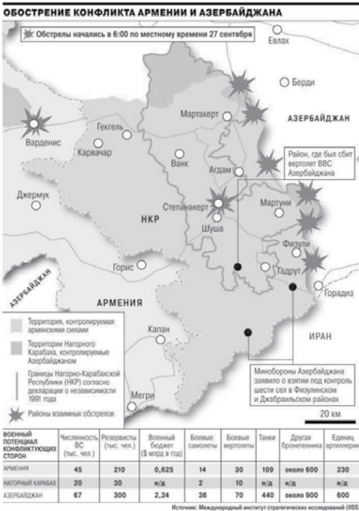
Преглед ситуације на дан избијања рата 2020. године (Naked science – Новости науки)

На самом почетку, изведени су припремљени удари на положаје јерменских система ПВО, чиме је одбрану Нагорно Карабаха лишила до 80% тих система. Остваривање ваздушне супериорности омогућило је Азербејџану да уз помоћ беспилотних летелица непрекидно, нон-стоп и несметано напада јерменске моторизоване и механизоване јединице, наносећи им значајне губитке и пре него што су ушли у битку са снагама Азербејџана (Vukosavljević 2021).