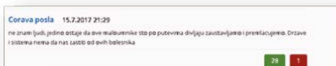
Slika 2: Govor mržnje na portalu Vijesti

U oba portala su objavljeni komentari koji sadrže sarkastičan stav prema učesnicima saobraćaja, sarkastičan komentar na fotografiju, dok na portalu Vijesti su prisutniji komentari u kojima se ismijavaju ili vrijeđaju novinari. Na ovom portalu nalazimo najveći broj komentara u kojima se novinari kritikuju zbog nepismenosti.