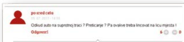
Slika 1: Govor mržnje na portalu Analitika

Na portalu Vijesti takođe nalazimo govor mržnje upućen učesnicima u saobraćaju nakon teksta o pogibiji dvije osobe između Trstena i Ploča. Komentator pod nikom ćorava posla predlaže da nesavjesne vozače treba zaustavljati i premlaćivati.