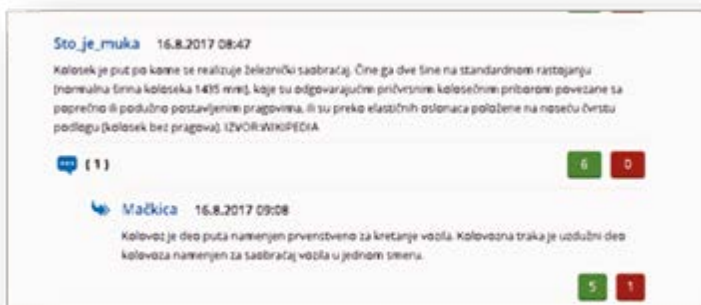
Slika 4: Komentatori objašnjavaju novinarima značenje riječi kolosek

Nakon teksta o saobraćajnoj nesreći u Pljevljima na portalu Vijesti objavljen je komentar pod nikom irvas u kojem se ismijeva novinar „Hahaha. kakav tekst. Sudarili se pezo 307 i kolasinac mm. Koja li je to marka auta hahaha (irvas). Na portalu Analitika tekst „Automobil izletio sa puta Vilusi – Grahovo“ je izazvao reakciju komentatora pod nikom a dje ovdje koji ismijava vozača jer je skrenuo sa puta. „Dao mu ga malo po gasu pa mu pobjegao put“ (03.07.2017,