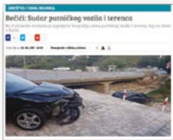
Slika 5: Tekst na portalu Analitika