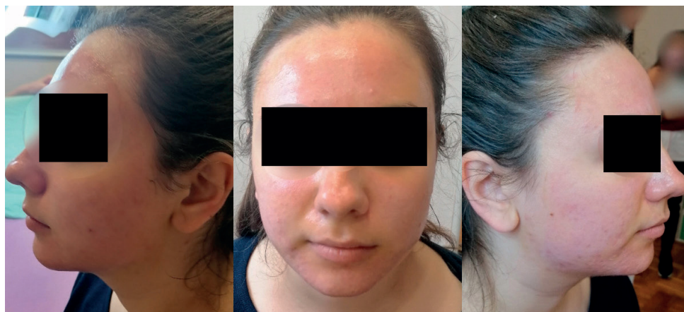
Slika 3. – Izgled kože neposredno nakon tretmana

U prilogu su fotografije procesa oporavka praćenog kroz sedam dana nakon tretmana kao rezultat primenjene terapije. Na slici 3. može se primetiti blago crvenilo i sedefasti odsjaj kože kao posledica frostinga (koagulacije belančevina na površini kože) neposredno posle tretmana.