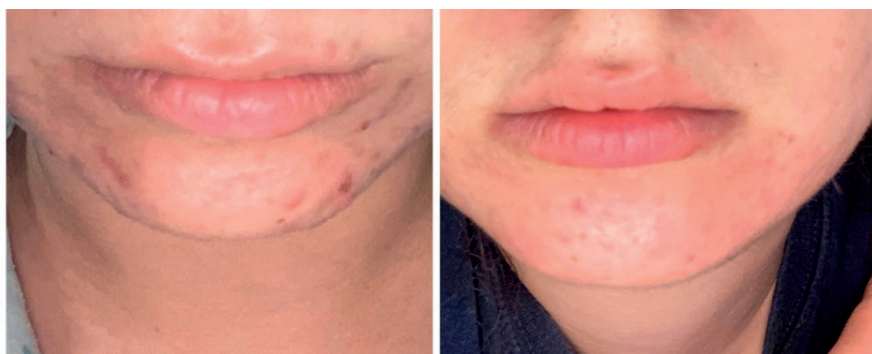
Slika 8. – Izgled kože pre (levo) i posle (desno) jednog tretmana trihlorsirćetnom kiselinom

tretmana. Jasno je vidljivo da su oblici atrofičnih ožiljaka u značajnoj meri smanjeni.