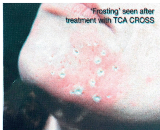
Slika 2. – Pojava tačkastog frostinga nakon primene TCA, prisutni su ice pick ožiljci (Ignjatović, 2021)

Frosting, krajnja tačka tretmana: dok se koža tretira, dolazi do pojave bele boje ili „mraza“ usled koagulacije epidermalnih i dermalnih proteina na površini kože, ova pojava naziva se frosting. Difuzno crvenilo sa laganim oblačasto-belim tragovima koje nestaje za 10 do 15 minuta ukazuje na površnu povredu (epidermis) i generalno je željena krajnja tačka kod upotrebe rastvora TCA koncentracije manje od 35% (slika 2.). Uniformni beli frosting ukazuje na epidermalnu i papilarnu dermalnu povredu i krajnja je tačka za 35–40% TCA piling, a takođe nestaje tokom 10–15 minuta. Sivo-beli frosting ukazuje na duboku papilarnu do retikularnu dermalnu povredu i krajnja je tačka za pilinge srednje dubine sa 50% TCA. Ovaj frosting obično nestane za 40–45 minuta. Za površinske pilinge koji koriste 10–30% TCA poželjna je pojava ravnomernog crvenila ili svetlo beličasti film, pa je ponovna primena na neravna ili nereagujuća područja tokom istog tretmana moguća.