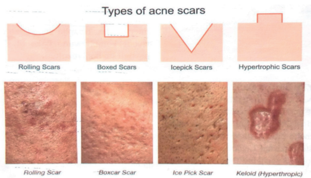
Slika 1. – Tipovi ožiljaka od akni (Ignjatović, 2021)

Boxcar ožiljci imaju oštre bočne ivice kao kutije, a mogu biti okruglog ili ovalnog oblika. Ovi ožiljci mogu biti dublji ili plići i ne sužavaju se prema dubini. Slične su širine u dubini kao i na površini kože i veoma podsećaju na ožiljke od varicela (6, 7).