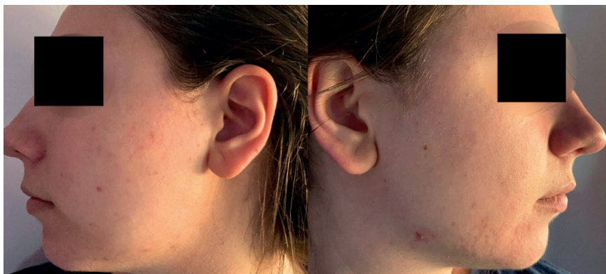
Slika 7. – Izgled kože nakon procesa oporavka (sedam dana nakon tretmana)

Sedam dana nakon tretmana (slika 7), koža je potpuno oporavljena sa vidnim poboljšanjem u smislu upalnih akni i ožiljaka.