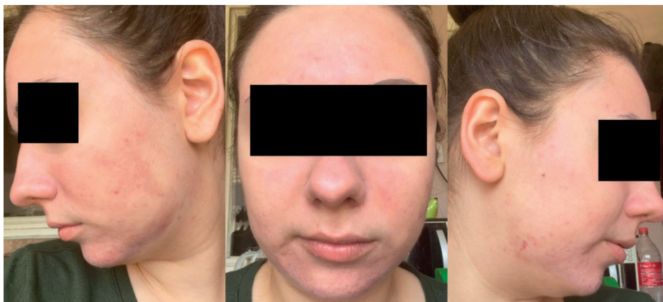
Slika 4 . – Izgled kože prvog dana nakon tretmana

izgled kože nagoveštava početak procesa keratinizacije. Upalni procesi (akne) su se značajno smanjili.