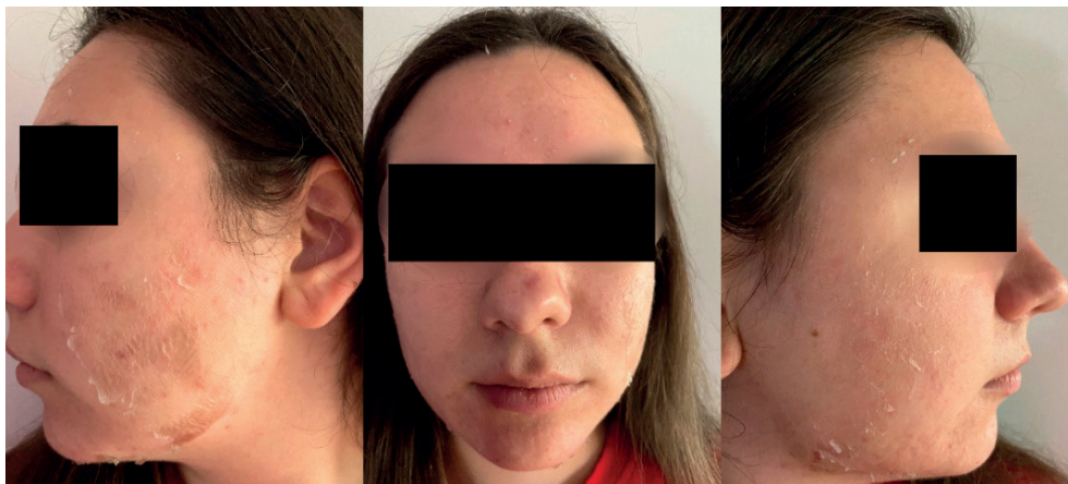
Slika 6. – Izgled kože tri dana nakon tretmana

Sedam dana nakon tretmana (slika 7), koža je potpuno oporavljena sa vidnim poboljšanjem u smislu upalnih akni i ožiljaka.