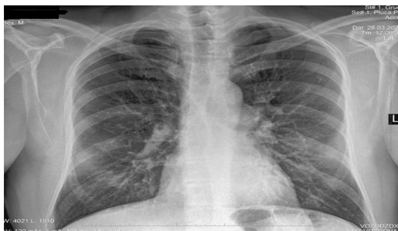
Slika 1. RTG pluća

Na RTG pluća evidentno hipoapikalno i hilobazalno obostrano peribronhovaskularno zadebljanje. KF sinusi bez izliva ( slika 1 ).