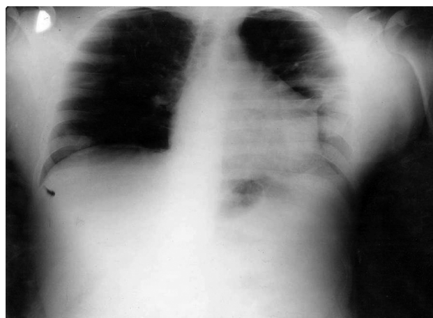
Slika 2. – Nalaz rentgenskog pregleda pluća desetog dana bolesti

Potom je pacijent intubiran i stavljen na program arteficialne ventilacije. Radi kontinuiranog hemodinamskog monitoringa plasiran je i centralni venski kateter. U laboratorijskim analizama se registruje značajno povišenje vrednosti kreatin kinaze i laktat dehidrogenaze (LDH), uz metaboličku acidozu, hipoksemiju, hiperkapniju i hipoalbuminemiju, znaci renalne insuficijencije sa smanjenom diurezom i oštećenjem jetre (tabela 1).