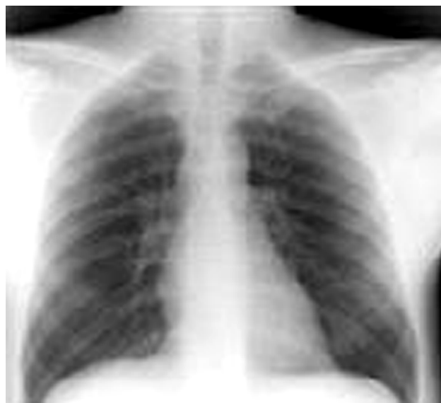
Slika 1. – Nalaz rentgenskog pregleda pluća petog dana bolesti

započeta je empirijska terapija antibioticima širokog spektra. S ciljem razjašnjenja etiologije febrilnog stanja urađene su virusološke analize (HBsAg, antitela na HCV i HIV) i imunoserologija (ANA, AMA, ANCA, Latex RF i Waaler-Rosae, Coombs test) i svi nalazi su bili uredni. Ultrasonografskim pregledom abdomena (EHO) registrovana je hepatosplenomegalia: jetra promera 143 mm, homogena, a slezina promera 148 mm, takođe homogena. I EHO srca i rentgenski pregled (RTG) pluća bili su urednog nalaza (slika 1). Rtg nalaz je bio sledeći: u prikazanom delu plućnog parenhima se ne uočavaju aktivne patološke promene, kosto-frenični sinusi su slobodni a hemidijafragme su jasno konturisanе.