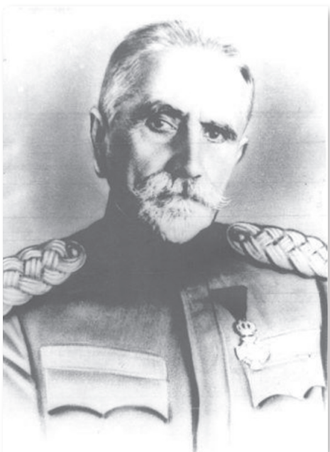
Slika 2. Mihailo Petrović (Karlovac 1863 – Beograd 1934) je bio sanitetski brigadni general jugoslovenske vojske prvi srpski hirurg, profesor Medicinskog fakulteta Univerziteta u Beogradu, osnivač hirurškog odeljenja Vojne bolnice u Nišu, šef Hirurškog odeljenja Prve poljske bolnice u Dragomancima na Solunskom frontu od 1916–1918. u kojoj se istako kao ratni hirurg i neumorni operator, pisac brojnih zapaženih naučnih radova iz oblasti hirurgije, u dva navrata predsednik Srpskog lekarskog društva

U izveštaju za rad zdravstvenih ustanova u Nišu za 1899. godinu dr Mihajlo Petrović beleži da je kod jednog bolesnika sa prolapsom dužice izvršena exeresis, u dva bolesnika sa corpus alienum perforans corneae učinjena je ekstrakcija, kod tri bolesnika sa