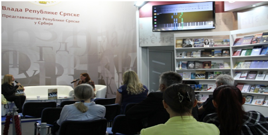
Промоција публикације Универзитетски уџбеник вокално-инструменталне наставае/музике на штићану Представништва Републике Српске у Србији (2023)

Аутентична промоција Универзитетског уџбеника вокално-инструменталне наставае/музике одржана је у Вршцу, на којој су, у комбинацији с мултимедијалним концертом, представљени вредности и савремени приступ изради ове публикације.