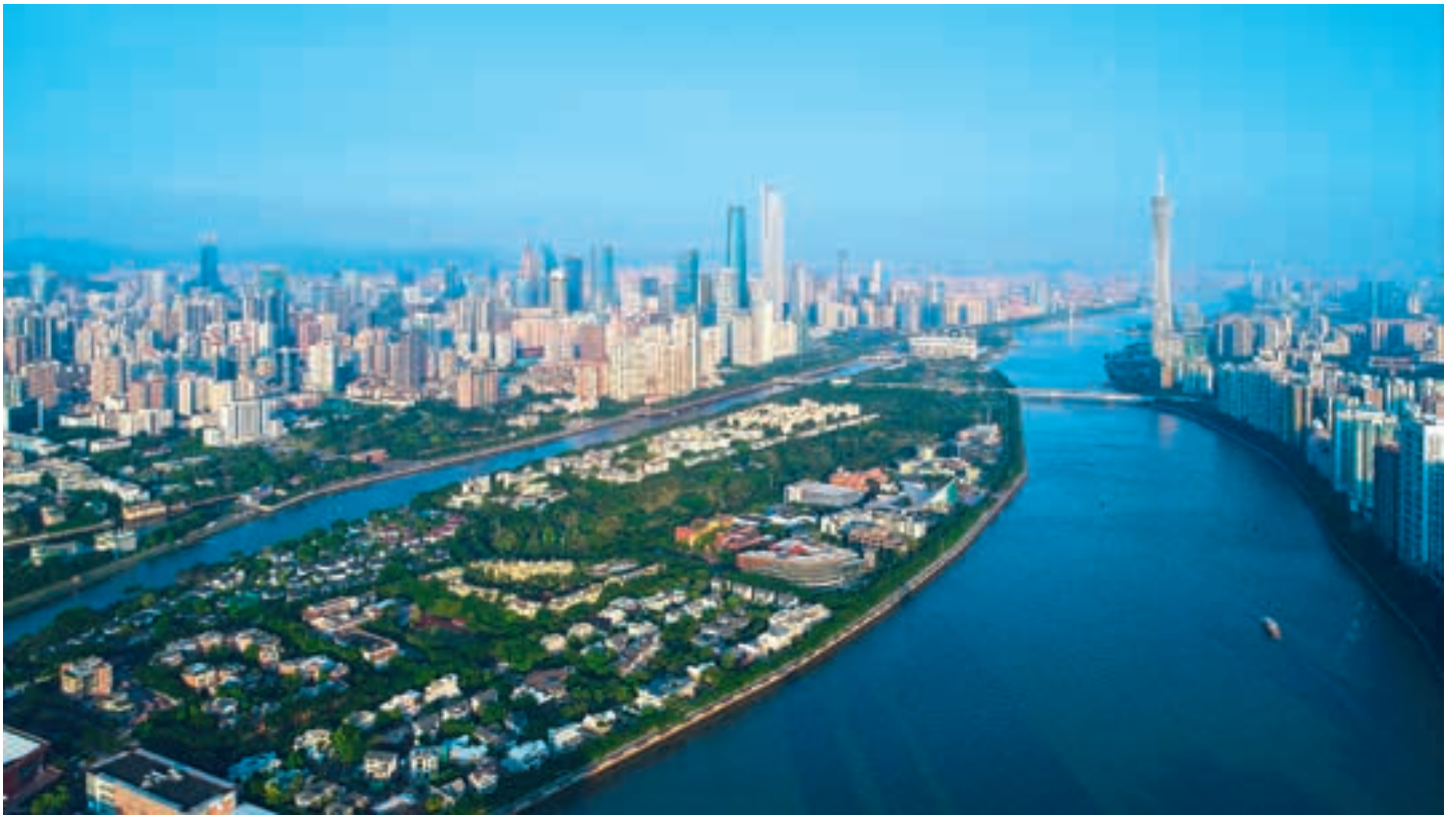
Поглед на град Гуанџоуа у Гуангдонг провинцији