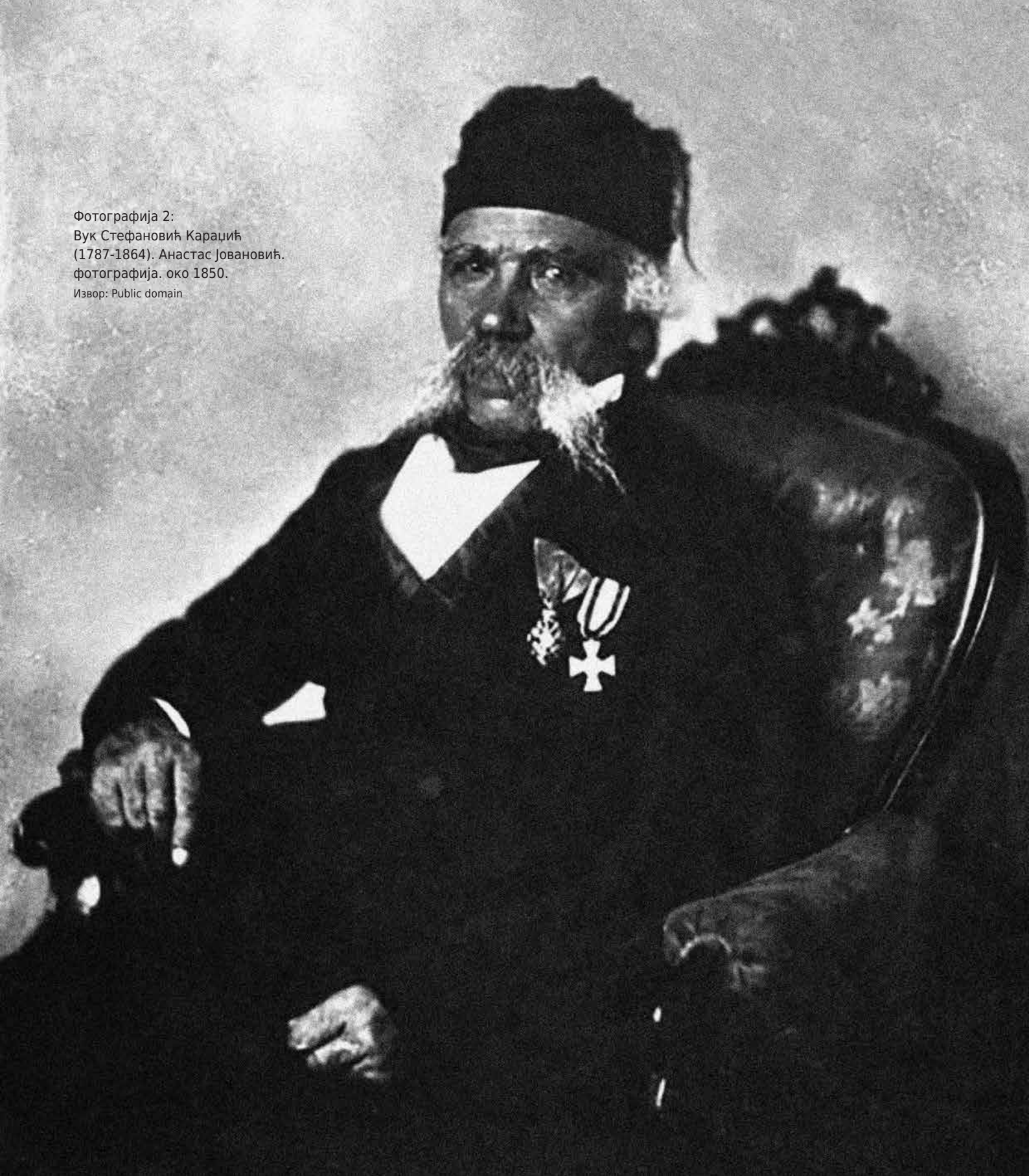
Фотографија 2: Вук Стефановић Караџић (1787-1864). Анастас Јовановић, фотографија, око 1850.