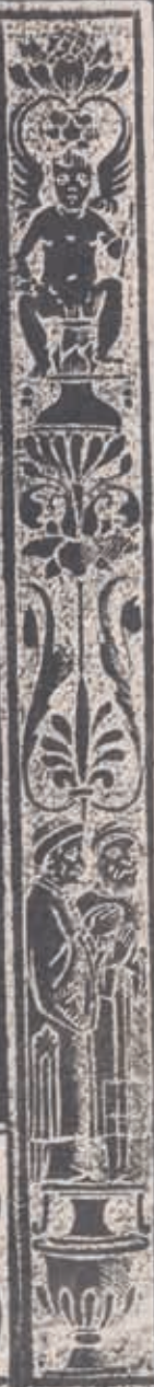
Фотографија 1: Снимци Српског молитвеника из 1512. године, прве две стране. Архив Српске академије наука и уметности, Историјска збирка 8873/II.