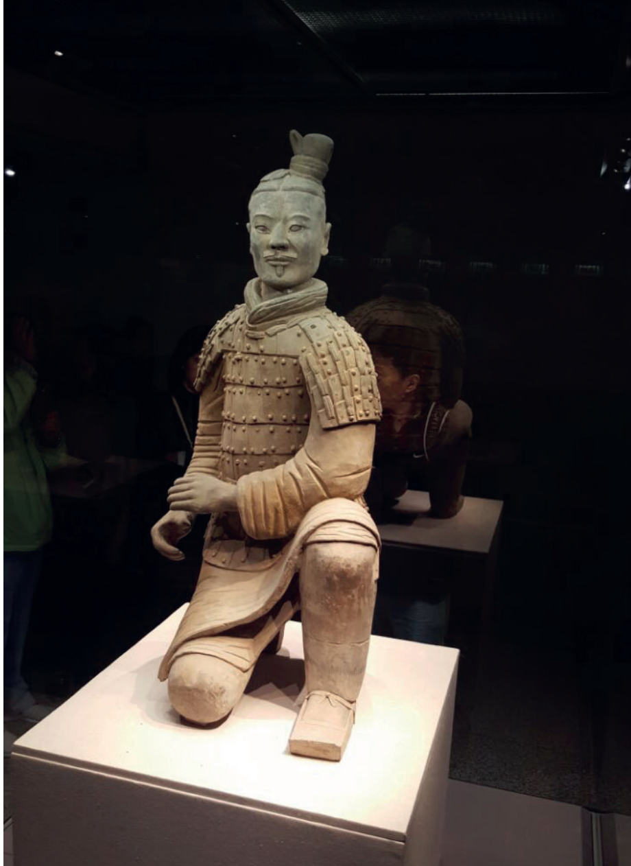
Скулптура ратника Сјена направљеног од теракоте, недалеко од града Сијан, провинција Шенси