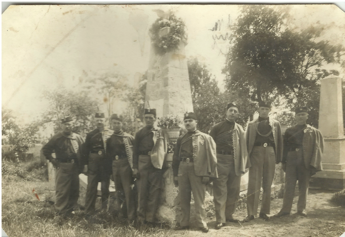
Výbor staropazovského Sokolského spolku pred pamätníkom dobrovoľníkom, hrdinom Veľkej vojny, neskoré dvadsiate roky minulého storočia

Úloha Slovákov v rozvoji staropazovského sokolstva: jednota pod slovanskou zástavou