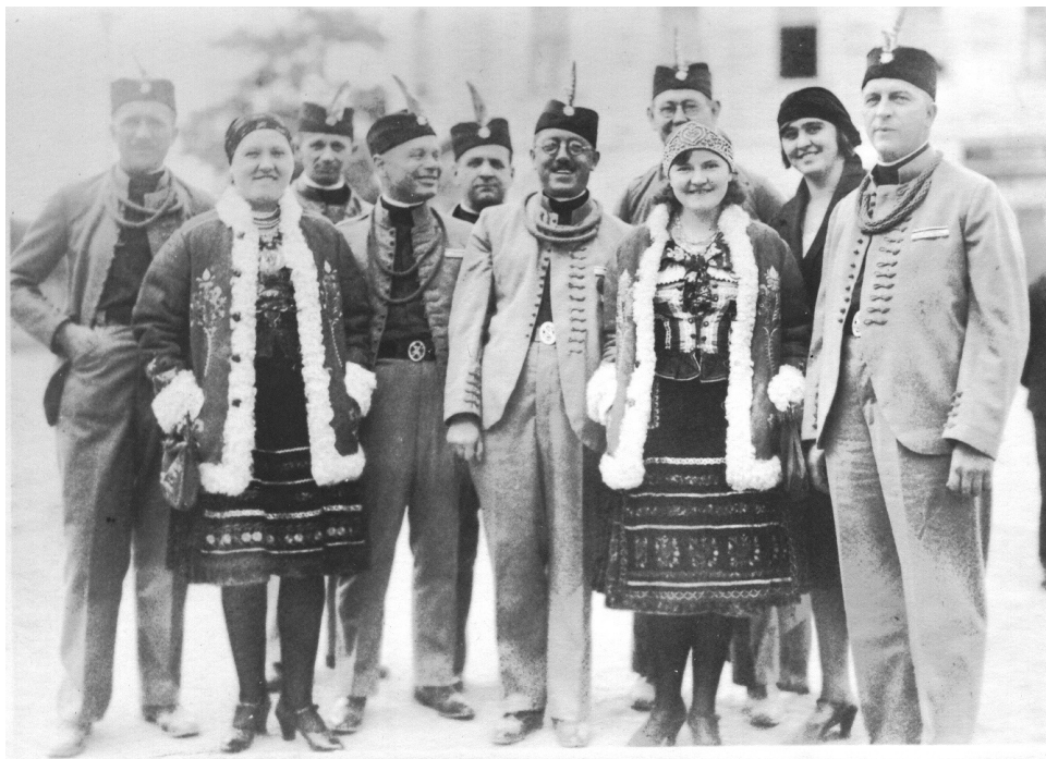
Členovia staropazovského Sokolského spolku so sokolkami oblečenými v slovenskom ľudovom kroji.