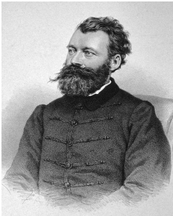
Svetozar Miletić, litografia z roku 1867