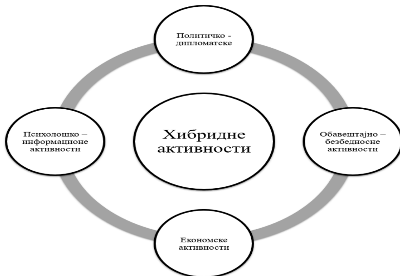
Шема 2. Хибридне активности на КиМ