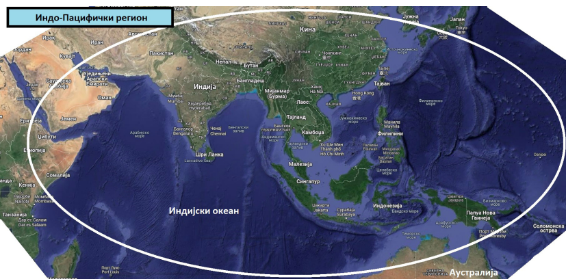
Слика 1. Регион Индо-Пацифика

две од три највеће светске економије – Кину и Јапан и више од половине светског бруто производа (Auslin 2011). У свом индо-пацифичком стратешком извештају из јуна 2019. године, „Секретаријат одбране САД” још детаљније описује регион Индо-Пацифика наводећи да је седам од десет највећих светских армија стационирано у овом региону, да пет земаља овог региона поседује нуклеарно наоружање, да се у њему налази девет од десет најпрометнијих поморских лука, као и да се трећина светског поморског саобраћаја одвија његовим морима (The US Department of Defense 2019).