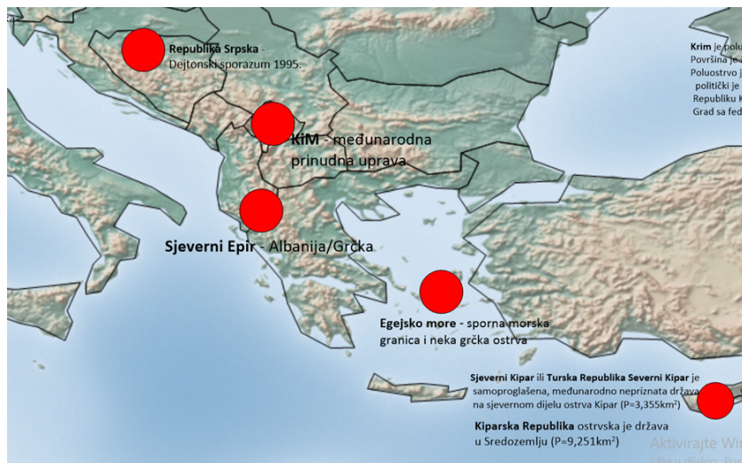
Слика 3. Неуралгичне тачке на Балкану