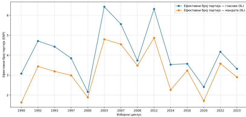
Графикон 3. Фрагментација бирачке и парламентарне арене у Србији (1990–2023)