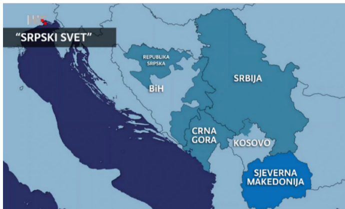
Карта 1. Територијална димензија концепта „српски свет”, представљена на ХРТ 23. септембра 2021. године