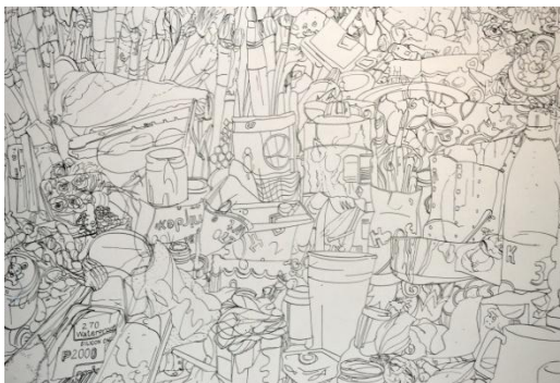
Слика II: Ждерић Т, Мртва природа , туш и перо на папиру, 50x70cm, 2014

Друга метода практичног усмерења, јесте метода огледала. За њено успешно извођење потребно је постављање огледала испред рада. На тај начин се врло јасно разазнају недоследности и несугласја у раду (Јаблан, 1984). Иако врла слична првој методи, овај начин испитивања сопственог рада знатно ређе користим, чак би се могло рећи у изузетно ретким приликама, с обзиром да сам неповерљива према слици коју даје огледало јер оно увек да помало искривљену слику те се много више поуздам у своје чуло вида.