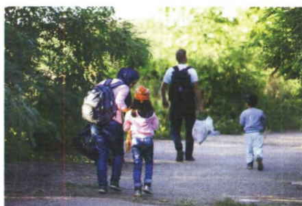
Слика 2. Снимак екрана, Полиџика , 28. 6. 2016./ Image 2. Print screen, Politika , 28 th June 2016