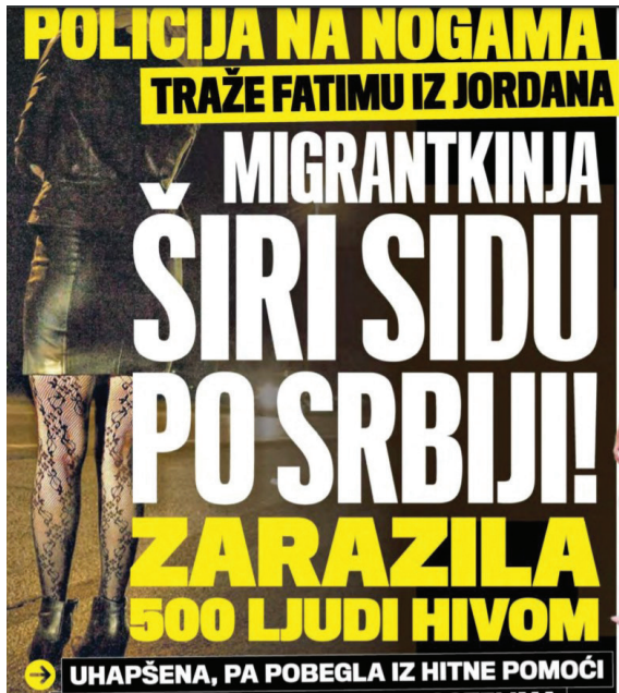
Слика 4. Снимак екрана, Kurir , 28. 6. 2018. / Image 4. Print screen, Kurir , 28 th June 2018