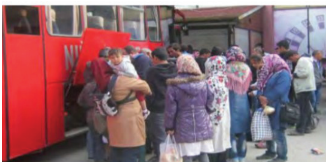
Слика 8. Снимак екрана, Блиц , 28. 6. 2015. / Image 8. Print screen, Blic , 28 th June 2015