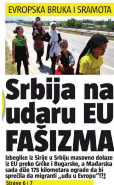
Слика 3. Снимак екрана, Информер , 19. 6. 2015. / Image 3. Print screen, Informer , 19 th June 2015