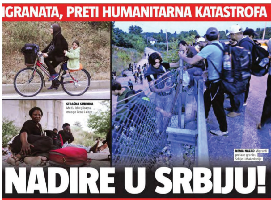
Слика 1. Снимак екрана, Информер , 23. 6. 2015. / Image 1. Print screen, Informer , 23 rd June 2015