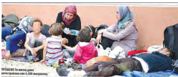
Слика 7. Снимак екрана, Вечерње новости , 25. 6. 2015. / Image 7. Print screen, Večernje novosti , 25 th June 2015