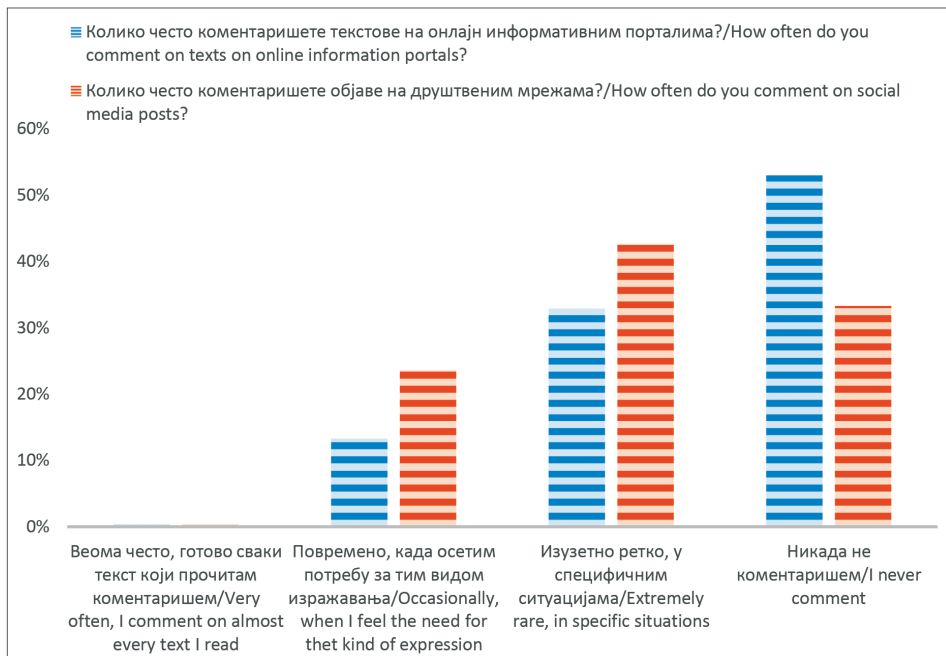
Графикон 1 – Учесталост коментаришања текстова на онлајн информативним порталима и објавама на друштвеним мрежама / Chart 1 - Frequency of commenting on texts on online information portals and posts on social networks