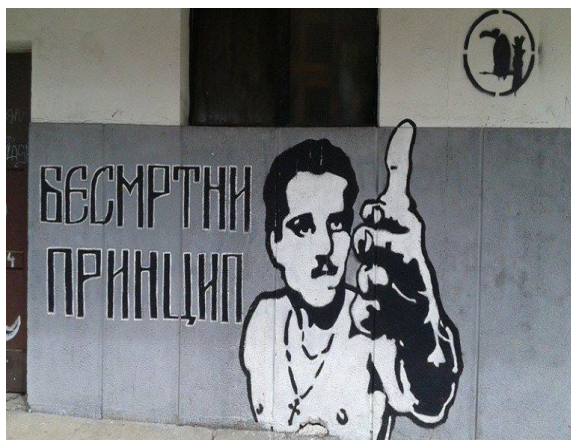
Слика 5: Принцип као супкултурни херој

револвера, док крст око његовог врата, иако од секундарног значаја, конотира са појмовима жртве и правде. Улоге центра и маргине у овом случају изнова су изместиве, али се њихови садржаји преливају творећи хибридни простор у којем је тешко разликовати прошлост, садашњост и будућност.