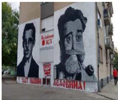
Слика 7: Победници/поражени

о Дражи Михаиловићу нису били уједначени у протеклих седамдесет година, па се репрезентације о њему, у зависности, од историјског и политичког контекста, крећу између оних о издајнику и оних о мученику.