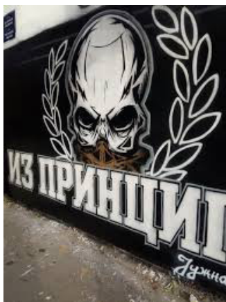
Слика 9: Из Принципа

Спорт ритуализује насиље, па идентификација са навијачима омогућује каналисање агресивности и њено преумеравање изван простора резервисаног за ауторитете и етаблиране социјалне вредности. Мета постају означени спољашњи непријатељи, најчешће навијачи друге групе, или припадници других културних, идеолошких, националних и уопште, социјалних група (Џоловић 1997, 269). У протеклих тридесет година, у Србији, институције изнова проглашавају борбу против навијачког насиља, што постаје платформа на којој ове групе производе властиту позицију жртве као неоправдано означеног државног непријатеља.