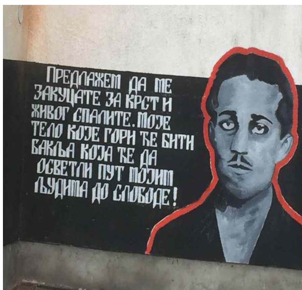
Слика 3: Мурал у Крагујевцу са Принциповим цитатом

извршиоца Сарајевског атентата носе њихова имена. Смештање и симболичко позиционирање њихових имена у простор главног града, открива интерну перцепцију њиховог појединачног значаја за извршење атентата, па улица Гаврила Принципа заузима централну позицију у старом језгру града, док се, рецимо, улица Недељка Чабриновића налази на Бановом Брду, а Васа Чубриловића у Земуну. Мало је онога што, спољашњем посматрачу, може објаснити како је Гаврило Принцип ушао у пантеон жртава и хероја-мученика, будући да не постоји објективна, емпиријски доказива реалност која обликује мученика. Њега чини перспектива сагледавања његове појавности.