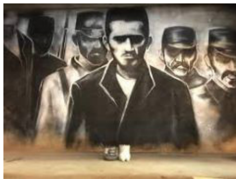
Слика 1: Принцип као Анонимус

Средином децембра 2018. године, Гаврило Принцип постао је заштитно лице новосадске пекара ПринциП , када је насликан мурал димензија 2,5 x 1, 6 м на којем је Принципово лице покривено маском Анонимуса, легендарног јунака Барутне завере. 1