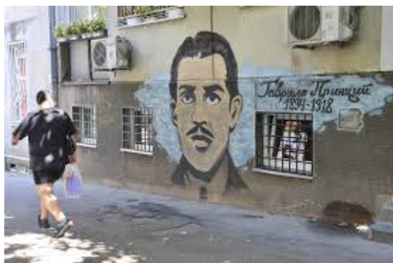
Слика 6: Принцип- мурал у Београду