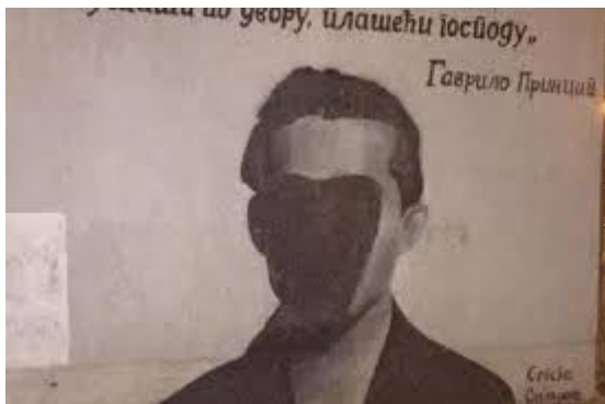
Слика 8: Принцип као заштитник навијача

Крајем деведесетих година и почетком трећег миленијума, слика Гаврила Принципа и реченице које му се приписују, неки су од неизоставних делова навијачке културе.