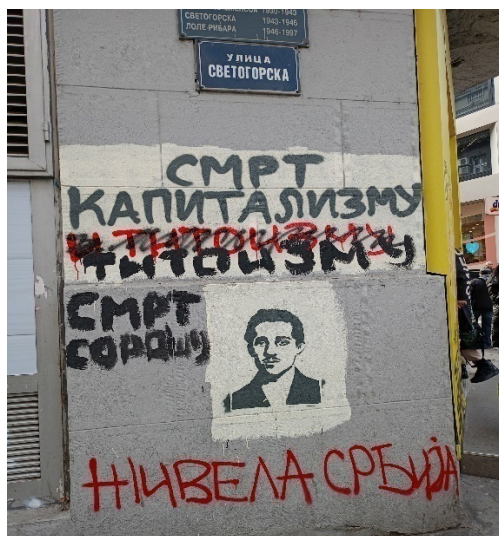
Слика 4: Отпор капитализму

у садашњости, било зарад инвестирања у будућност, било услед потребе да се нагласи незадовољство садашњим тренутком. Представа Принципа – мученика заправо је полазишна тачка из које настају даље обухватне и флуидне репрезентације. Она омогућује његово несметано кретање како у политичком, тако популарном дискурсу и упркос критици опстаје у новим формама деловања капиталистичког система.