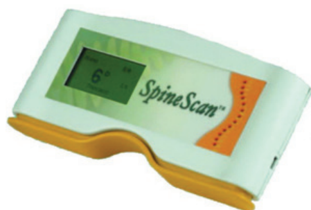
Slika 1. SpineScan uređaj

Procena posturalnog statusa kičmenog stuba urađena je SpineScan portabl uređajem (OrthoScan, Ltd.). SpineScan je inovativni uređaj koji omogućava brzu i tačnu procenu, te praćenje odstupanja od normalnog posturalnog statusa kičmenog stuba. Uređaj je neinvazivan (nema zračenja), a dijagnostikovanje aparatom vrši se po principu elektronske libele na bazi senzora pokreta i inklinacije karlice. Primenom aplikativnog softvera SpineScan uređaja automatski se evidentiraju, kvantifikuju i analiziraju podaci ispitivane posture (Slika 1).