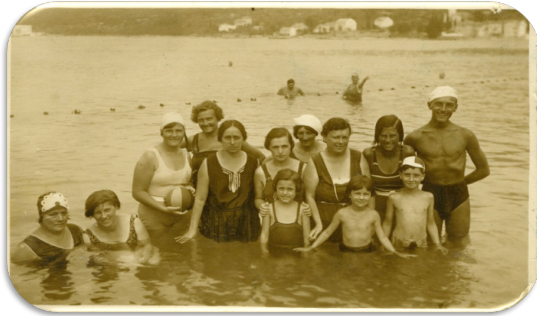
Slika 1. Beograđani na moru 30-ih godina XX veka. Zbirka Olge Popović-Obradović