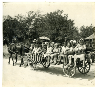
Slika 6. Izlet na Avalu 30-ih godina XX veka

U građi Odseka za štampu i turizam OGB nalazi se i jedan spisak „Beogradskih društava zainteresovanih za razvoj turizma“ iz 1940. godine. Na njemu su: Putnik , Savez Sokola Kraljevine Jugoslavije , Savez skauta Kraljevine , Jugoslovenski nogometni savez , Auto-klub , Jugoslovenski turing-klub , Srpsko planinsko i turističko društvo , Turističko društvo Fruška gora (sa sedištem u Novom Sadu), Dunavsko kolo jahača Knez Mihajlo , Zimsko-sportski podsavez , Uprava Beogradskog sajmišta , Zemaljski savez ugostiteljskih udruženja Kraljevine