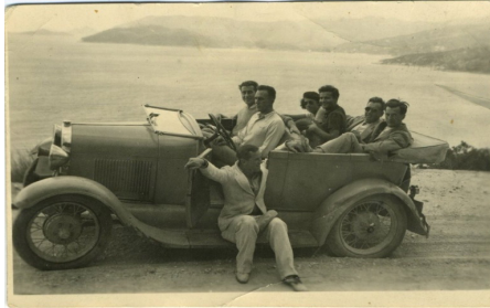
Slika 7. Automobilom na more

podataka za celokupnu istoriju turizma. U njoj, između ostalog, nalazimo podatke o beogradskim kupalištima, sokolskim svečanostima, sportskim utakmicama i udruženjima, turističke i hotelske oglašave.