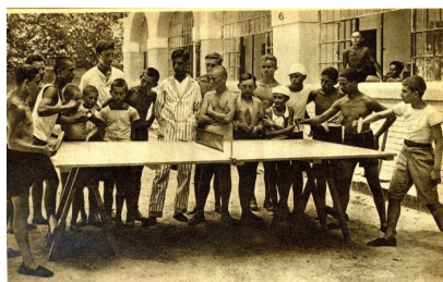
Slika 5. Školska omladina u letovalištu Jadranske straže , Martinšćica kod Sušaka

Shvaćen u tom širem smislu, turizam je tema koja je zastupljena u mnogim fondovima IAB-a. Društvo beogradskih ženskih lekara ima svoje odmaralište u Prčnju, Savez Sokola i Jadranska straža neguju omladinski i vaspitni, neprofitni turizam. Sistematski izvor statističkih podataka daje Statistički godišnjak Kraljevine Jugoslavije, ali se podaci nađu i u raznim jubilarnim izdanjima i spomenicama iz perioda između dva svetska rata.