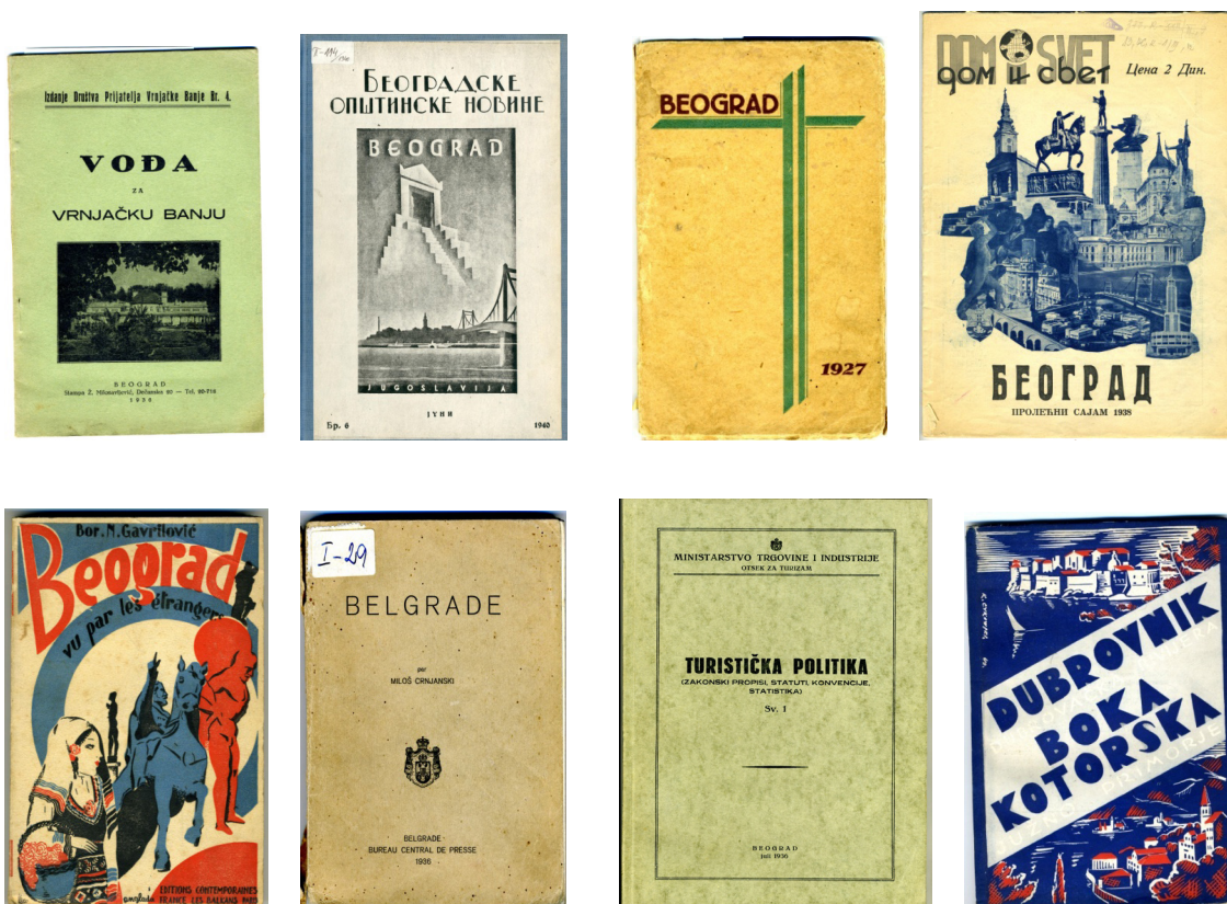
Slika 2. Primerici literature o turizmu između dva svetska rata, biblioteka Istorijskog arhiva Beograda

Bogata Zbirka Fotografija nezaobilazna je u traženju ilustrativnog materijala za svaku temu iz bogate i burne istorije Beograda. Iz nje se crpi građa za skoro svaku izložbu i publikaciju IAB-a. U okviru ove zbirke, vezano za temu turizma, posebno mesto zauzimaju razglednice Beograda i fotografije koje je arhivu poklonila gospođa Olga Popović-Obradović. U ostalim brojnim fondovima sporadično se nailazi na dokumenta u vezi sa turizmom u Beogradu između dva svetska rata.