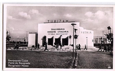
Slika 3. Spasićev paviljon na Sajmu.

nakit, parfimerija, staklo i porcelan, alkoholna i mineralna pića, optika, foto i kinematografija, rukotvorine, turizam...). Osim jugoslovenskih, izlagači su bili iz Nemačke, Italije, Čehoslovačke, Rumunije, Mađarske, Austrije, Danske, Švajcarske, SAD, Francuske, Engleske, Bugarske, Švedske, Belgije, Finske, Holandije i Japana. Prosečna poseta Beogradskog sajma bila je oko 200.000 posetilaca, tako da je on za trgovinu u međuratnom Beogradu imao veliki značaj. Skoro obavezni prateći sadržaj nastupa Jugoslavije na beogradskim i sajmovima širom sveta bila je izložba o turizmu.