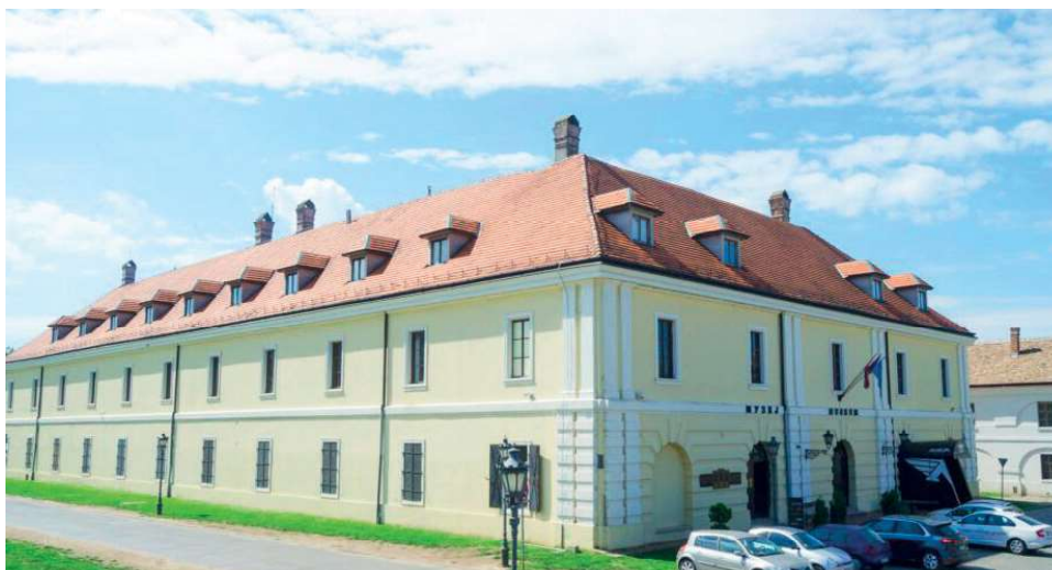
Slika 1. Centralna zgrada Muzeja Grada Novog Sada na Petrovaradinskoj tvrđavi