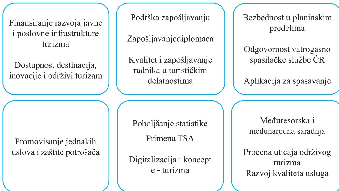
Slika 2. Šema srednjoročnih i dugoročnih mera za period 2021–2030 godina